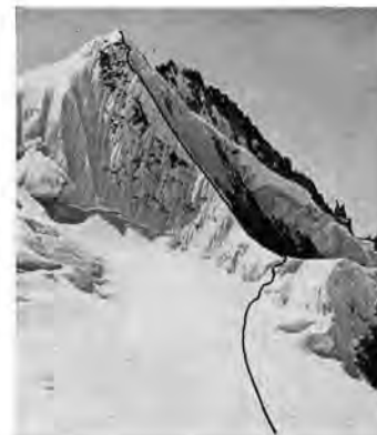
Die Südwand des OAE III (1). Die bedeutendste Unternehmung war der Illampu-Südgrat (2), er wurde bereits 1928 erstmals versucht; auch der Südgrat des Gorro de Hielo konnte als Neutor verbucht werden (3)