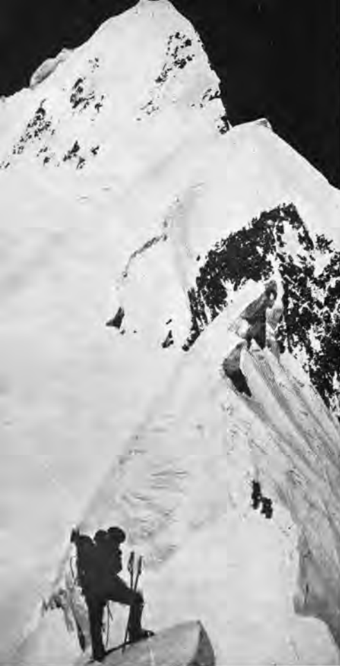
Der Roc Noir (7516 m), wuchtiger Eckpfeiler im Ostgrat der Annapurna I