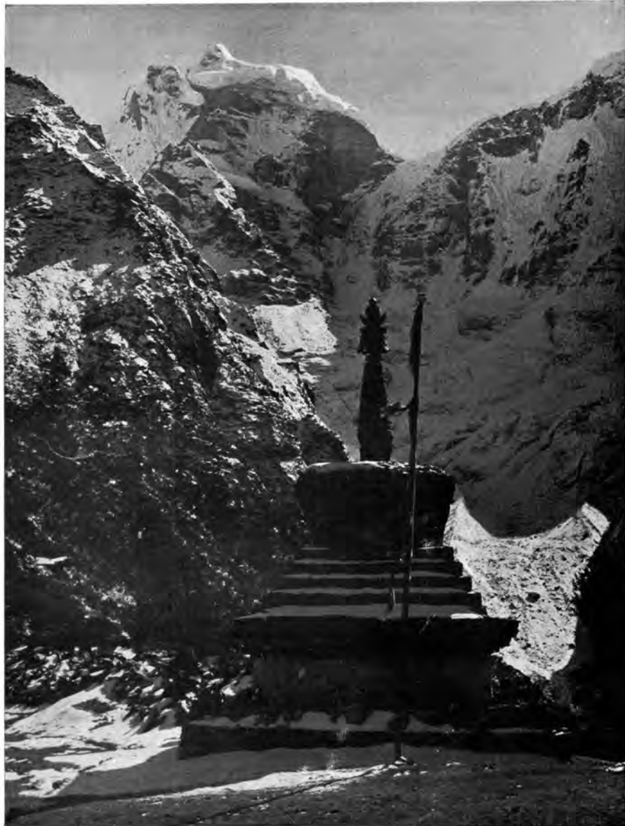
Ein tibetischer Chorten Im Hintergrund der Kang Tega (Eis-Sattel), 6685 m