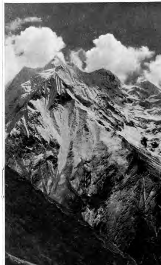
Das Gabelhorn (6165 m) im nördlichen Gratverlauf des Macha Puchare in der Annapurna-Gruppe