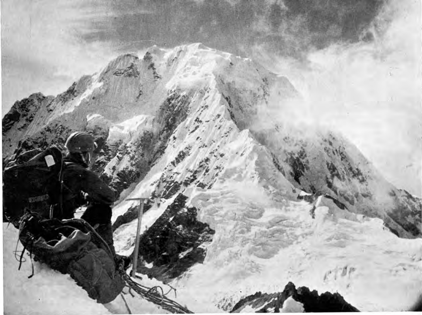
Der Salcantay (6271 m) von Südosten