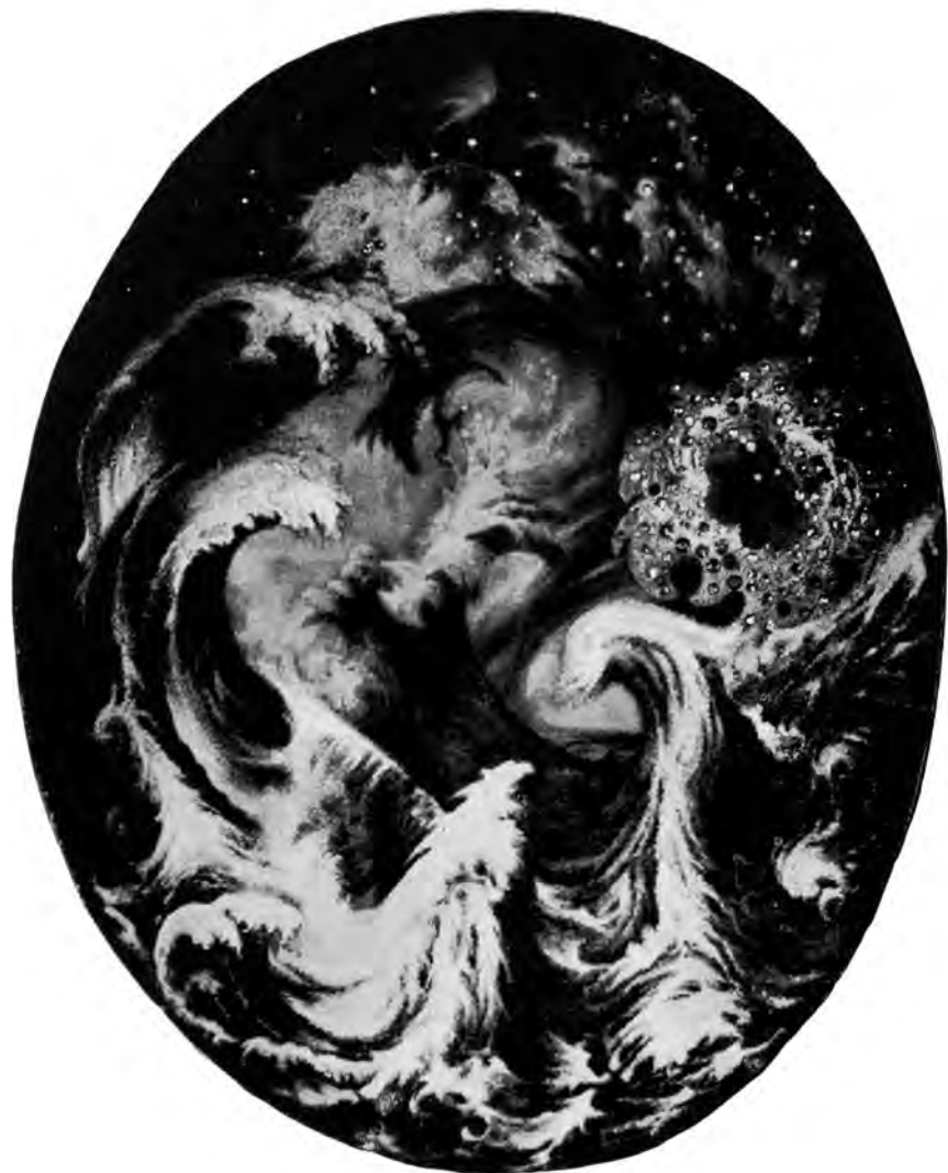
Kurt Geibel-Hellmeck Schöpfung: Werk 3