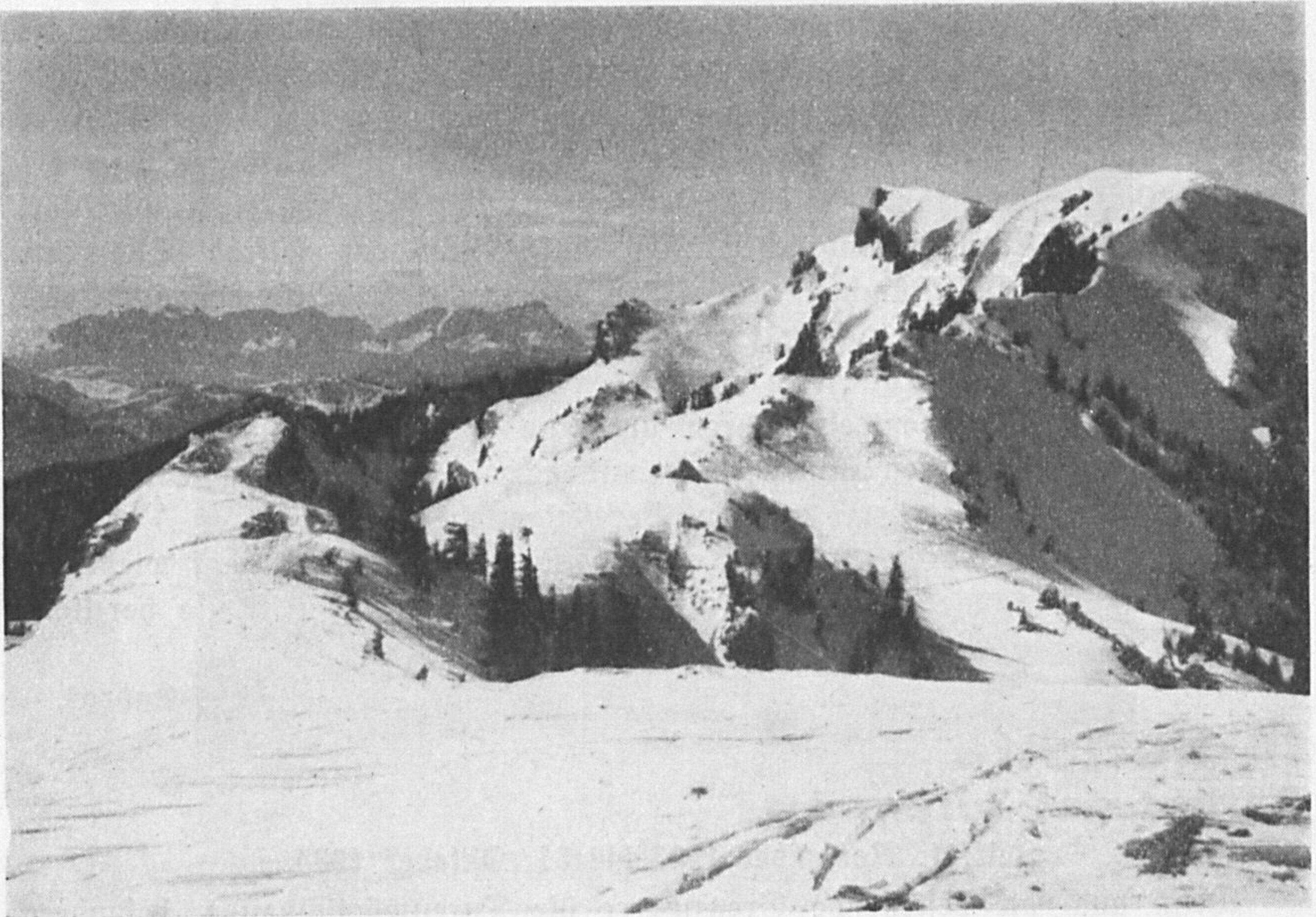
Blick vom Brauneck auf Latschenkopf und Wetterstein