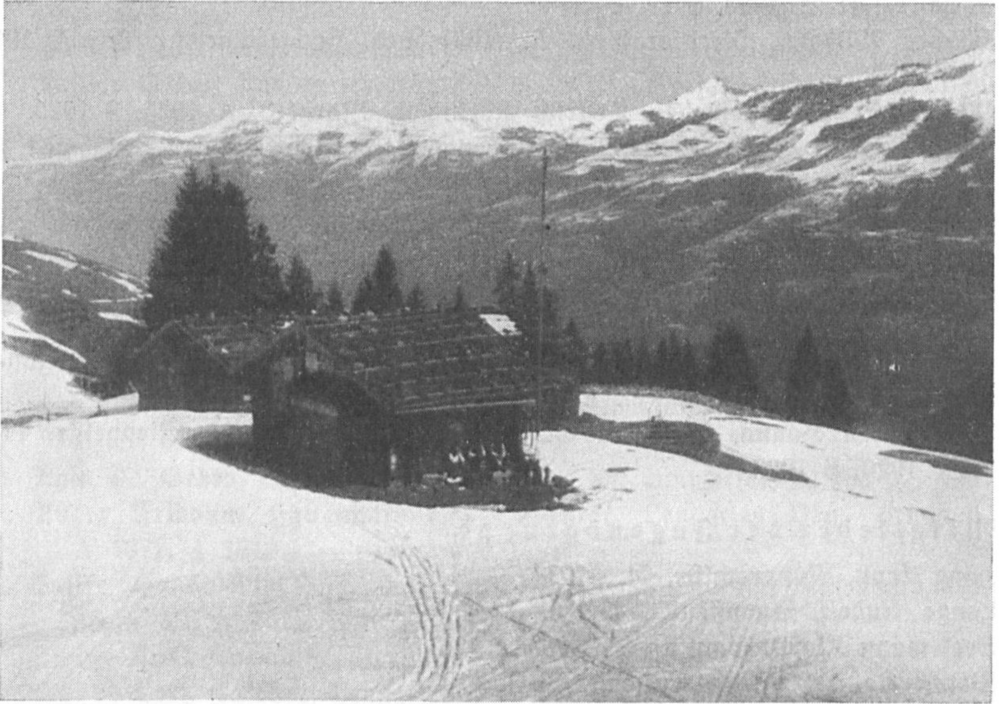
Bärnbadkogel-Hütte bei Jochberg in Tirol