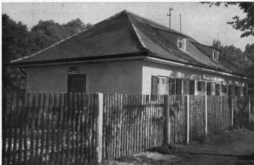
Bootschhaus der Galtboot-Riege des M. T. V. an der Zentralländstraße

Der Krieg und seine schweren Folgeerscheinungen haben die Allgemeinheit des Volkes mehr und mehr von der Notwendigkeit einer geregelten Leibesertüchtigung überzeugt. Dieses erhöhte Verständnis für Leibesübungen machte sich in all unseren Abteilungen geltend. Standen die Aktiven vor dem Kriege mit einer Höchstzahl von 120 am Platze, so zeigte sich nach dem Kriege gleich in den ersten Jahren eine durchschnittliche Besucherzahl von 200 und mehr, die sich bis auf den heutigen Tag erhalten hat. Daneben wuchs die Leichtathletikabteilung zu einer Stärke von 130 bis 150; die Fechtrierge weist bei ihren Übungen eine Zahl von 40 Besuchern auf. Die neuen Strömungen für Körperkultur in der Frauenwelt wuchsen sich in unserem Verein zu prächtigsten Blüten aus. Können wir doch heute an Hand der Statistik feststellen, daß an den Frauenturntagen (Montag und Donnerstag in 4 Abteilungen) durchschnittlich 540 bis 580 unsere Übungsstätten besuchen. Der M. T. V. bemüht sich, den Bedürfnissen der einzelnen weitest entgegenzukommen; aus diesem Gesichtspunkt heraus wurde auch eine eigene rhythmische Abteilung gegründet. Die schon vor dem Krieg eifrig betriebenen Spielarten entwickelten sich in den letzten Jahren (besonders Handball, Schlagball, Faustball, Tennis) ganz erfreulich; Fußball und Hockey sind wieder neu aufgenommen worden.