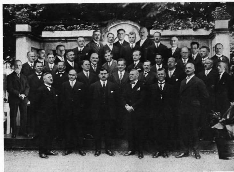
Turnrat des Jubeljahres

Nach dem Kriege konnte das Haus dem Turnbetrieb wieder übergeben werden; die Abteilungen waren, wie der Mitgliederstand, bedeutend zusammengeschrumpft. Dank der aufopfernden Tätigkeit der verschiedenen Vorturnerschaften konnte nach kurzen Monaten wieder ein frisches Vereinsleben festgestellt werden, was die überaus starke