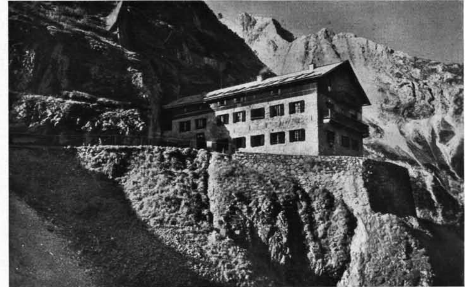
Karwendel-Haus der Sektion M.T.V.

Die Leichtathletikabteilung hat sich sehr bald der Deutschen Sportbehörde angeschlossen und kam dadurch später in Widerspruch mit dem Standpunkt, der dem Verein in der Frage Turnen und Sport durch die Deutsche Turnerschaft als Spitzenorganisation gegeben war. Der Zwiespalt in den Auffassungen führte leider zum Austritt der Leichtathletikabteilung aus dem M.T.V. im Jahre 1924. Nach der Trennung bemühten sich die M.T.V.-Führer unverzüglich, neuen Boden für