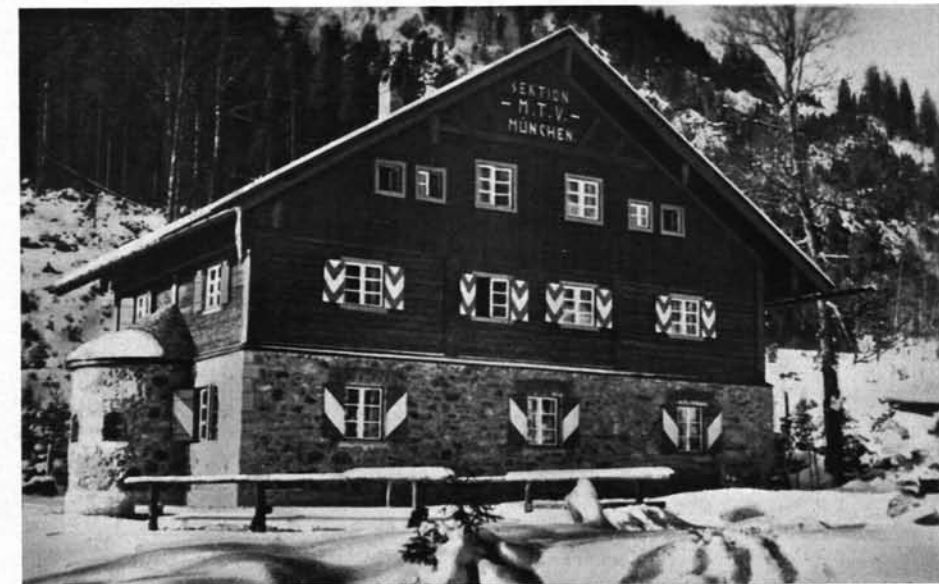
Bleckstein-Haus der Sektion M.T.V. in der Nähe des Epifingsees