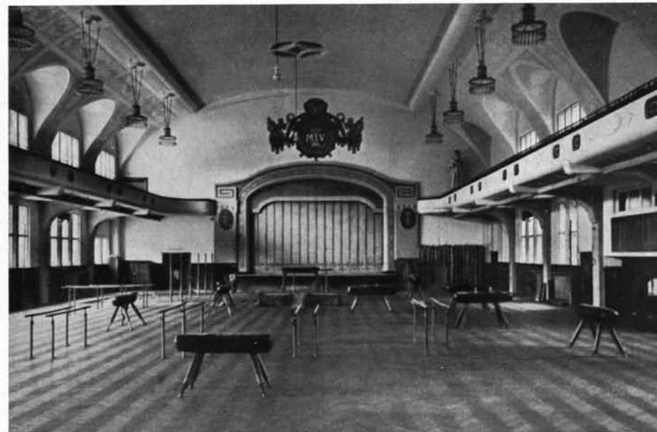
Großer Turnsaal (1010 qm)

Von Anfang seines Bestehens war der M.T.V. darauf bedacht, neben dem Turnbetrieb in der Halle seinen Mitgliedern auch Leibesübungen in frischer Luft und Sonne zu bieten. Nachdem im März 1896 ein Aufruf des Deutschen Bundes für Sport, Spiel und Turnen zur Beteiligung an den Olympischen Spielen und zur Förderung der Turn- und Jugendspiele überhaupt ergangen war, stellte der M.T.V. seinen im September 1896 erworbenen Platz in der Gemeinde Gräfelfing, Haltestelle Lochham, bereits in den Dienst dieser Leibesübungen. Ein Unterkunfts- haus, eine offene Halle, Umkleide- und Waschräume für Männer und Frauen