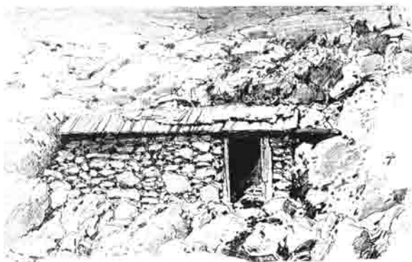
Simonys Unterstandshütte auf dem Dachstein

Wien, am 3. November 1932. Der Bundesminister: Jakoncig e. h.