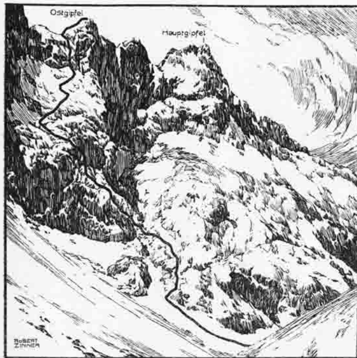
Die Nordostwand der hohen Warte.

Aus gewaltigen Lawinenresten ragt im Osten die stolze Felsenburg der Kellerwand empor, die an Größe und Einsamkeit wenig ihresgleichen hat. Im Norden erheben sich die mächtigen Berge der Gamskofel- und Mooskofelgruppe. Ihre Wände und Grate dünkten uns im grellen Sonnenschein kahl und formlos, nur die