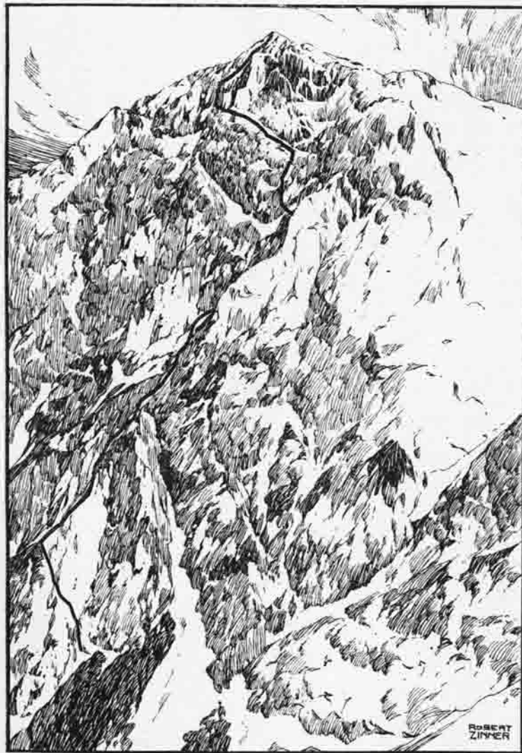
Tennock (2455 m, Übergoffene Alm)

Von vielen Dachsteinfahrten habe ich diese drei herausgegriffen, denn jede war unter anderen Umständen begonnen und durchgeführt. Zuviel und viel zu stark sind wir kleinen Stimmungen unterworfen, doch eines steht über allem — unsere Freude an den Bergen!