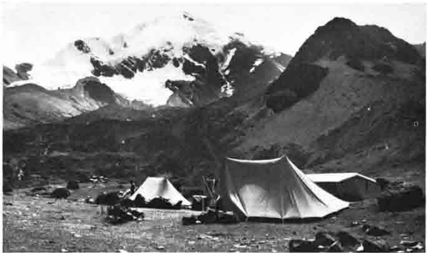
Hauptlager in der Calantica-Gruppe / Cordillera Real.

Natürlich war es eine andere Mannschaft. Aber stand sie nicht bildlich gesprochen schon auf den Schultern der ersten Gruppe? Profitierten die Zweiten nicht schon von dem Wissen und der Erfahrung der Ersten? Natürlich, einfacher wäre es gewesen,