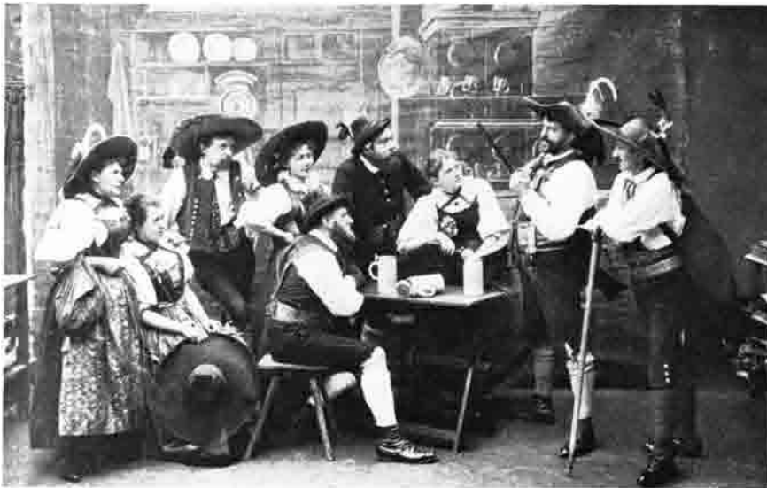
Die Schuhplattlgruppe der alten Sektion Berlin 1895.

Die Entstehung der Sektion Berlin ist durch eine Schlüsselfigur eng mit der des Deutschen Alpenvereins verbunden. Franz Senn, 1860—1872 Kurator in Vent/Otztal, erkannte als begeisterter Bergsteiger die Möglichkeit, welche der gerade erst entstehende Fremdenverkehr seinem armen Gebirgstal bringen konnte. Er richtete in seinem Heim entsprechende Unterkünfte her und veranlaßte, daß die Wege im oberen Otztal begehbar gemacht wurden. Im Venter Vidum waren sowohl die späteren Gründer der Sektion München als auch die der Sektion Berlin oft zu Gast, dort bildete sich das erste Bergsteigerzentrum. Pfarrer Senn stand allen als Ratgeber und oft auch als Führer zur Verfügung. In seinem Hause lernten sich die Gründer der Sektion Berlin kennen (Prof. Dr. Julius Scholz, Prof. Dr. Hirschfelder, Stadtgerichtsrat H. Deegen). Franz Senn gab dann den Anstoß zur Gründung im November 1869.