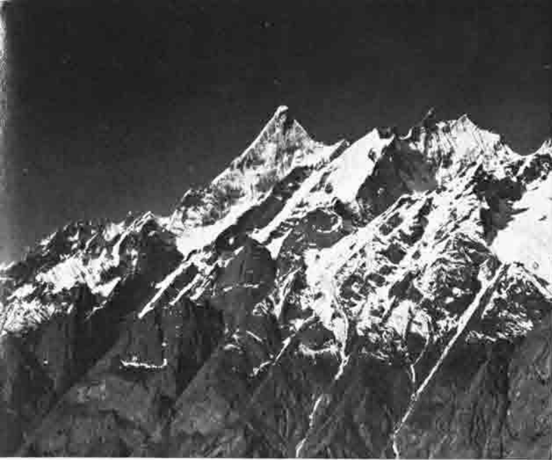
„Changi“, ein prächtiger etwa 6.500 m hoher unbestiegener Gipfel im westlichen Kondus-Kamm. Die „Aiguilles von Kondus-Kaberi“ harren noch alle ihrer Bezwinger.

Link Sar, das die Österreichische Karakorum Expedition 1961 vom Kondus-Gletscher her aufgenommen hatte. Und den Berg auf diesem Foto hatte der Leiter der OKK 1961 schriftlich als K 6 bezeichnet. Bei dieser Sachlage erübrigte sich alle weitere Nachforschung nach der Identität des abgebildeten Berges, der Grund für die Verwechslung des K 6 mit dem Link Sar war gelegt. (Die Ergebnisse von Noxon waren damals noch nicht veröffentlicht.)