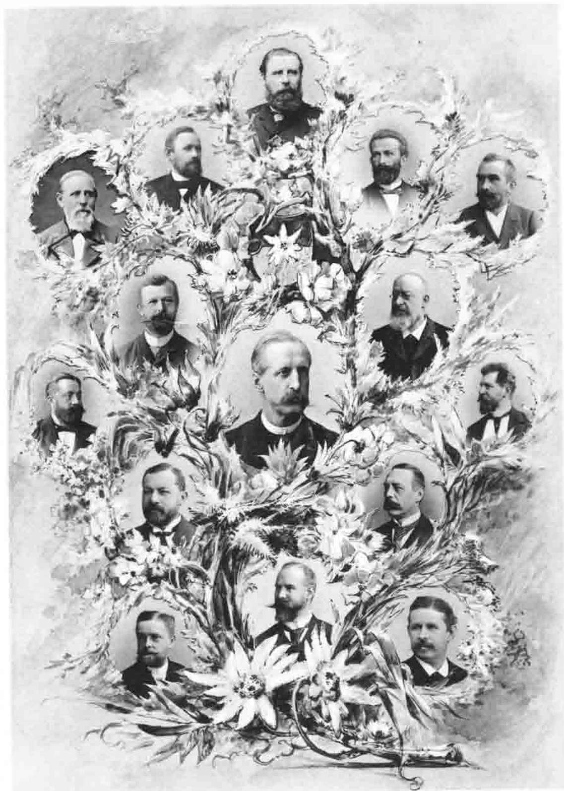
Der Vorstand der Sektion Berlin d. D. u. G. A. V. 1894.