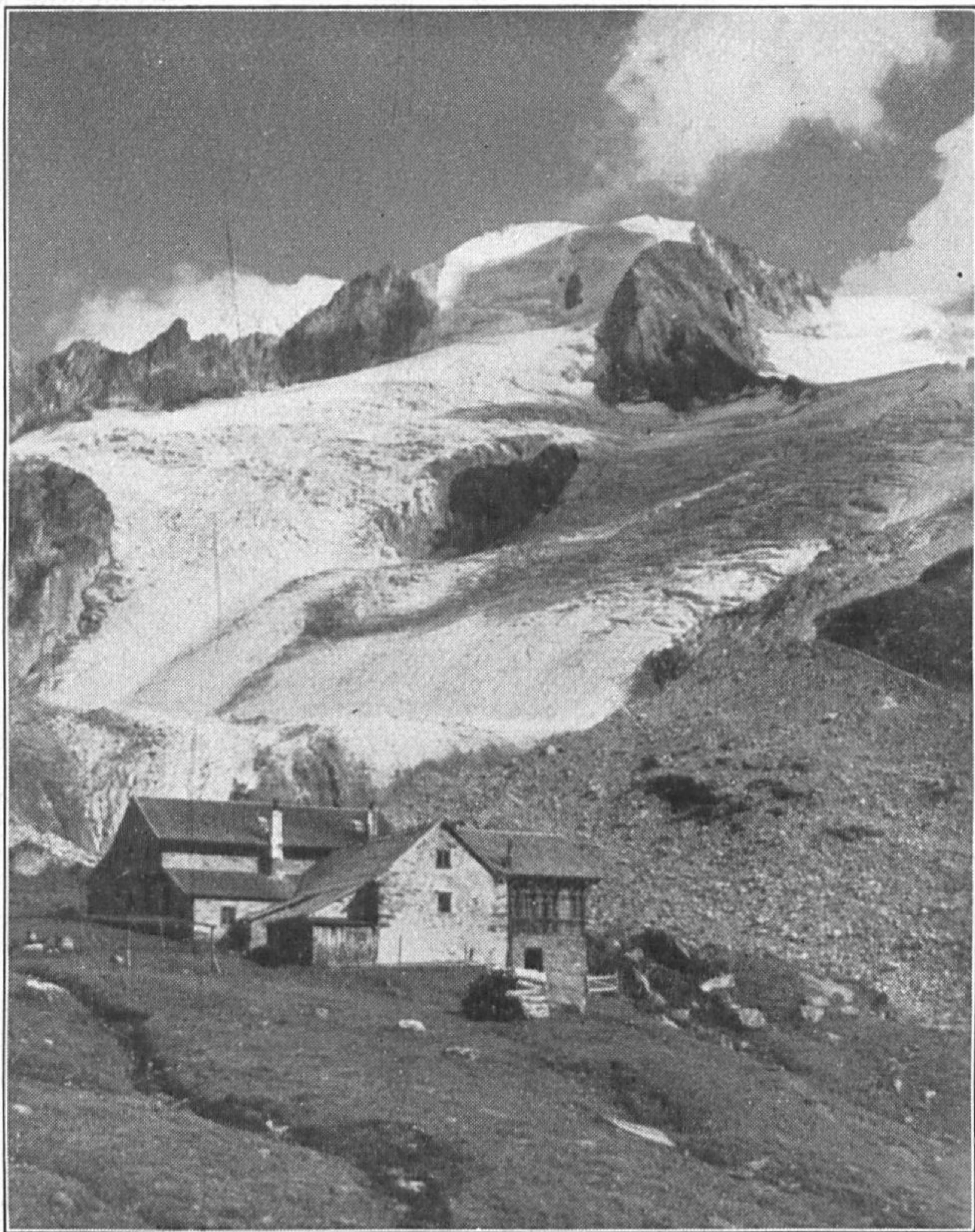
Furtſchaglhaus mit Möſele

Ein Teil der von der Berliner Hütte erreichbaren Gipfel wird auch vom Furtſchaglhaufe erſtiegen, wenn auch auf andern Anſtiegsrouten, wie z. B. der Greiner, das Schönbichler Horn, die Furtſchaglſpize, das große und das kleine Möſele. Selbſt der Thurnerkamp wird von hier aus mit Erfolg gemacht. Ein weiteres Hochturengebiet iſt das des Hochfeners und Hochſeilers mit den öſtlich davon liegenden Gipfeln, wie Breitnock, Mutnock, und Weißzint. Von den Übergängen iſt zu nennen der über das Schönbichler Horn, ſowie die nach Italien, die in der Jetztzeit jedoch nicht freigegeben ſind.