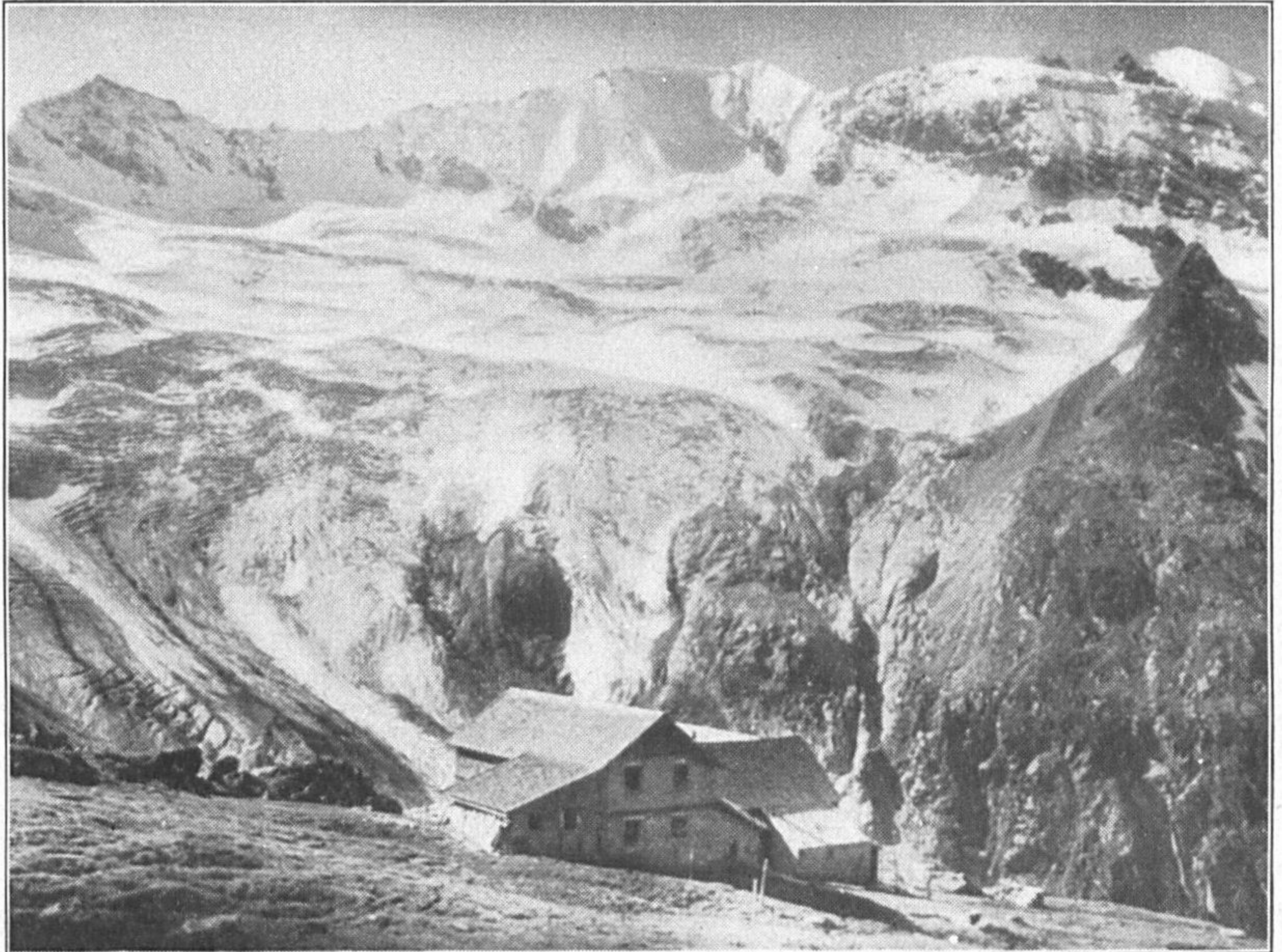
Furtchaglhause mit Schlegeiskees und Hochfeilergruppe.

der Sektion Berlin des Deutschen und * Oesterreichischen Alpenvereins *