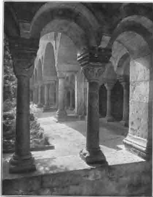
Kreuzgang im Bonner Münster