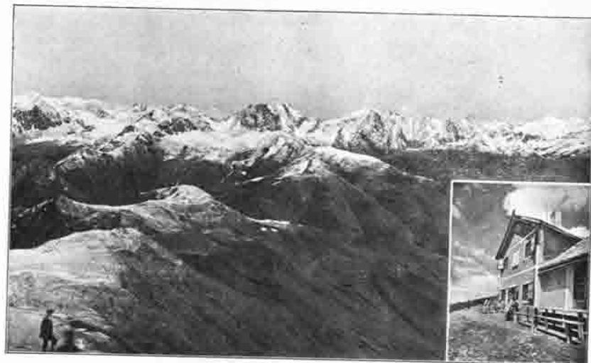
Blick vom Gipfel des Toblacher Pfannhorns gegen Norden Rechts: Bonner Hütte

So heut dem Wetter deinen Stiebel, Haus, Zeut deine Kammer uns zur ersten Rast, Zeut Sit und Tisch zum ersten Weihetrunk Uns, die wir gastlich uns in dir gefunden, Der Heimat fern und doch nicht heimatlos.