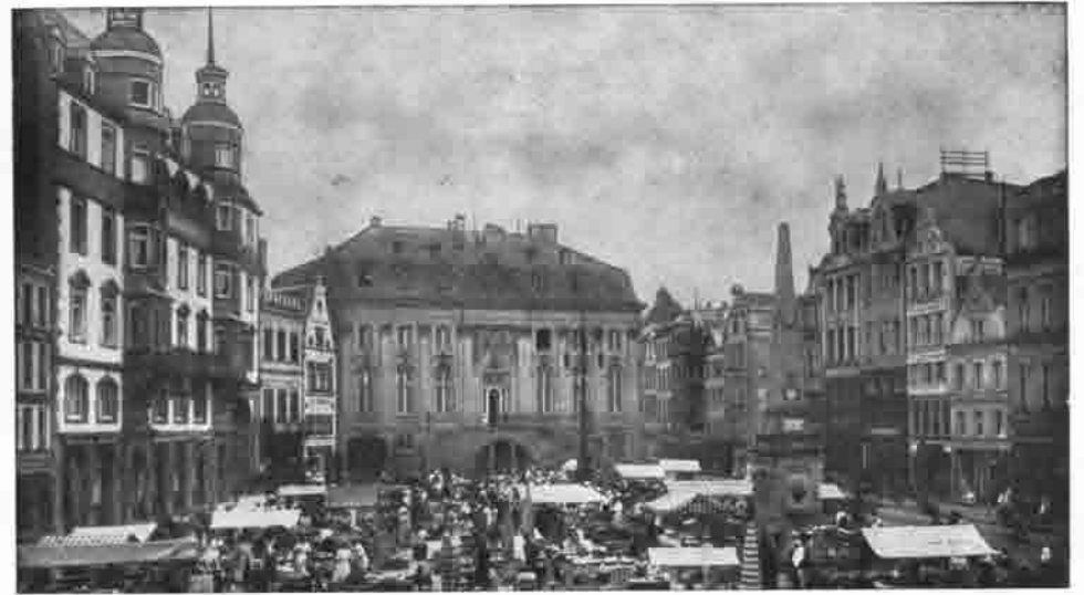
Bonn: Rathaus mit Marktplatz