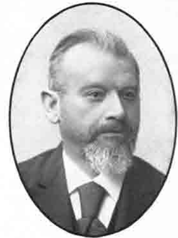
Johannes Justus Rein