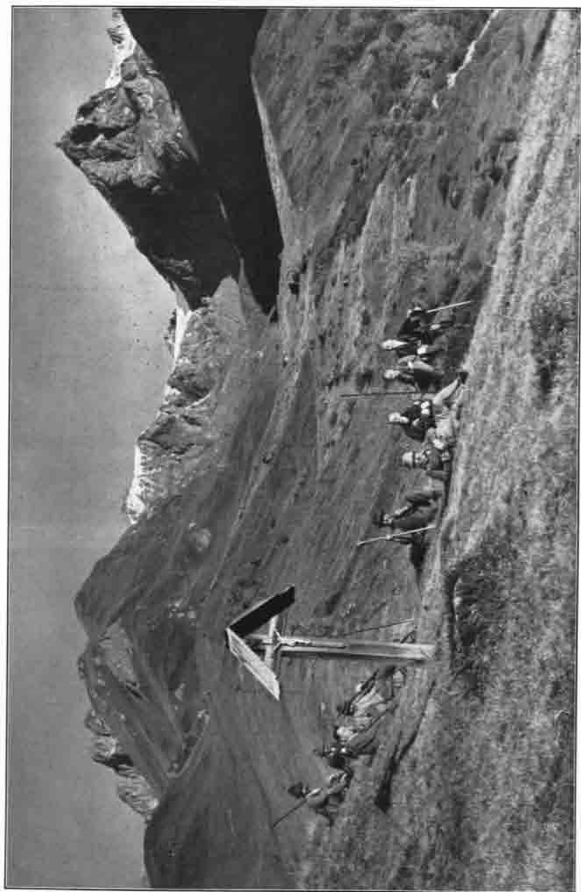
Oberes Mittelal, Aufstieg zur Bonn-Matreier Hütte