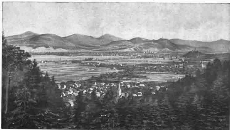
Siebengebirge und Gadesberg vom Venusberg bei Bonn