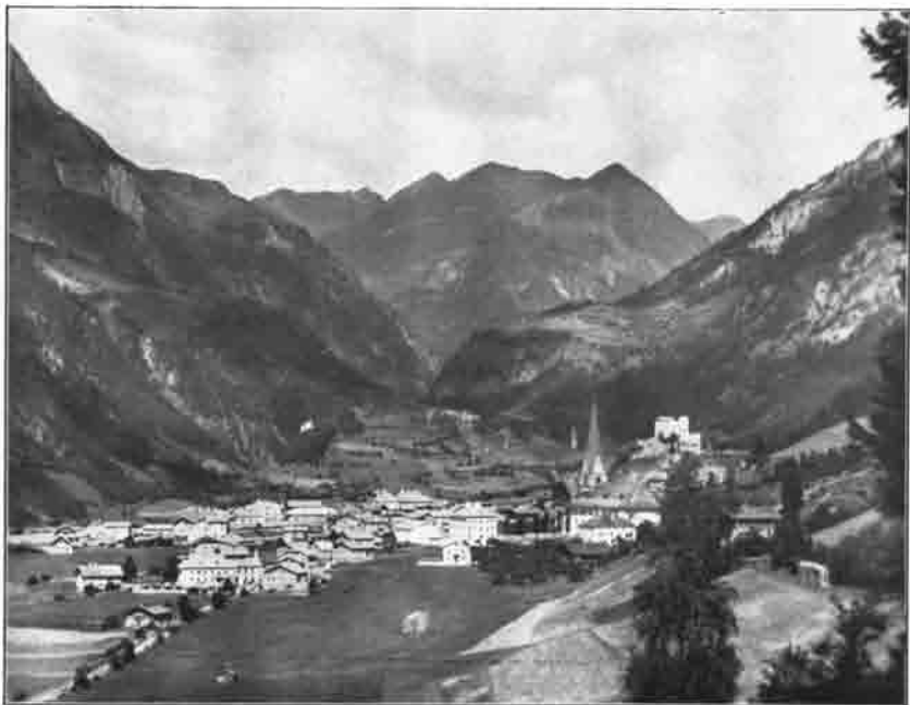
Matrei in Osttirol (Blick nach Norden ins Lauerntal)