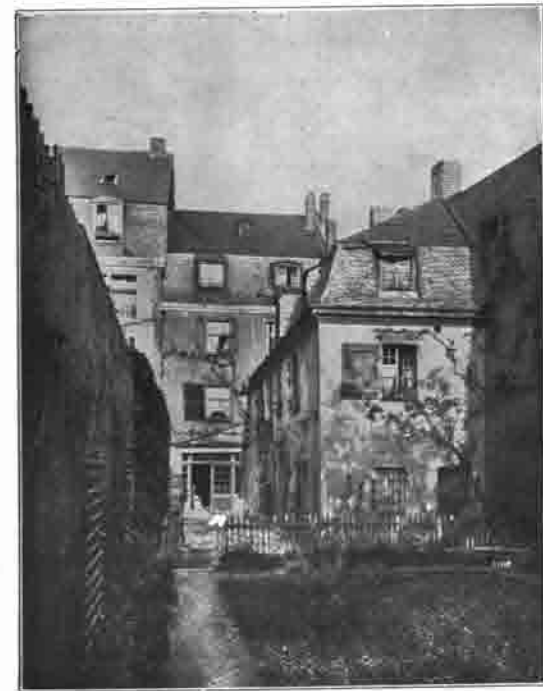
Bonn: Geburtshaus Beethovens (Gartenseite)