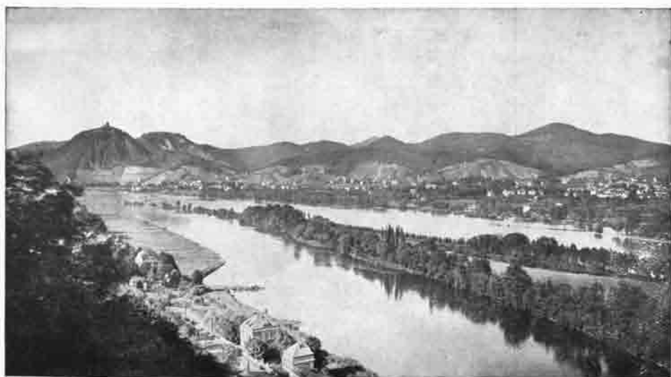
Rolandseck, Bad Honnef und das Siebengebirge