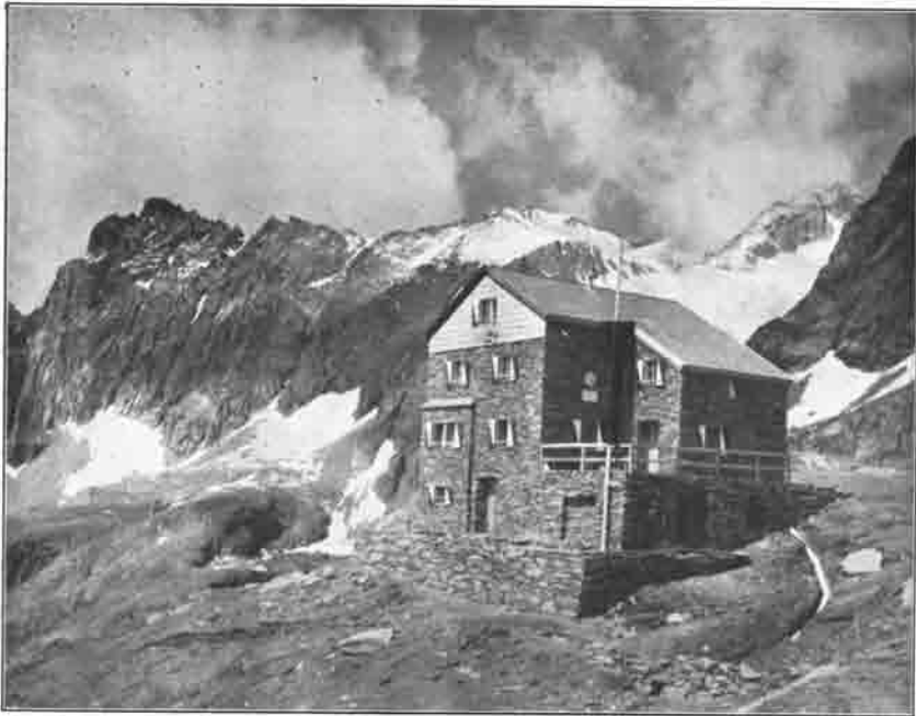
Bonn-Matreier Hütte mit Wunspigen (links), Nillkees und Eichham (rechts hinten)