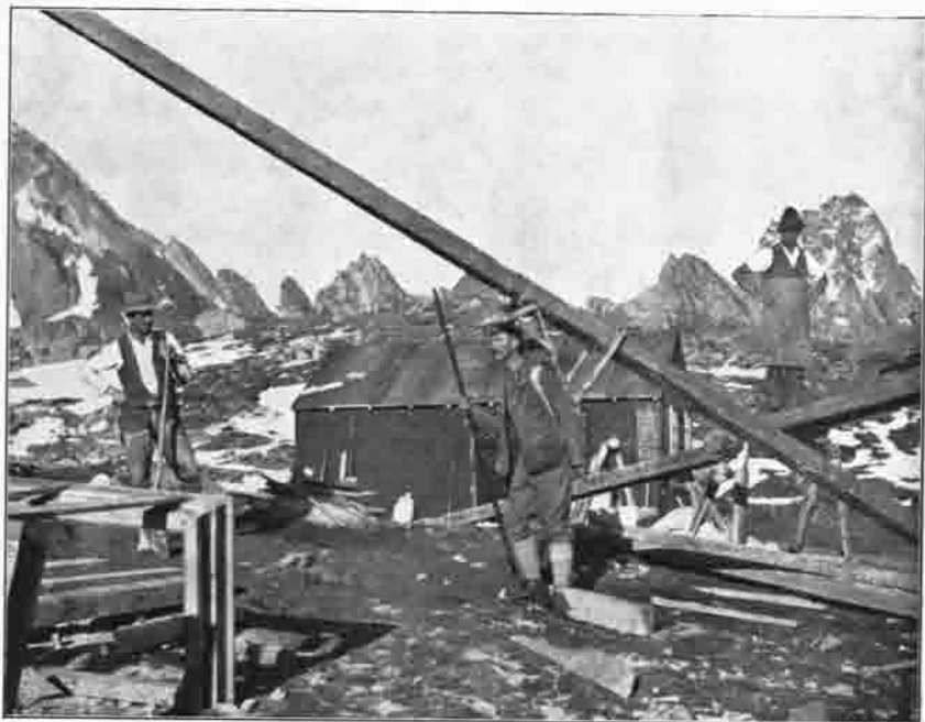
Beim Bau der Bonn-Matreier Hütte: Träger mit einem Balken von 8,6 m Länge und 86 kg Gewicht