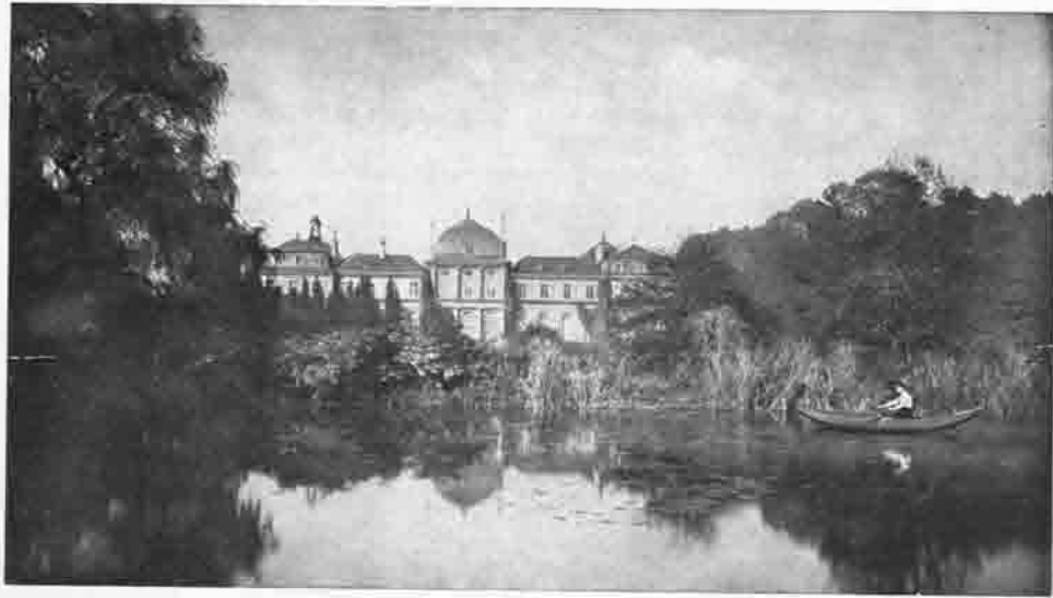
Bonn: Poppelsdorfer Schloß (im Botanischen Garten)