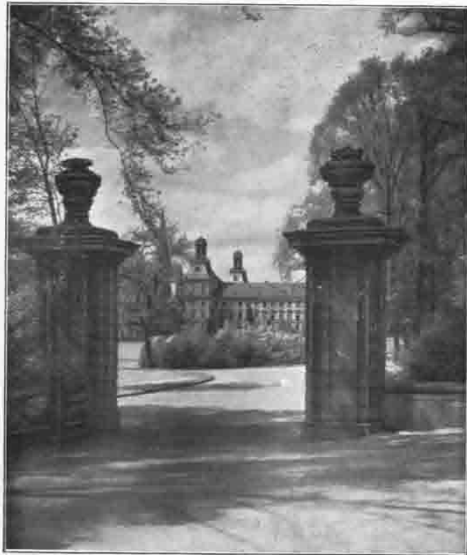
Bonn: Hofgarten mit Universität