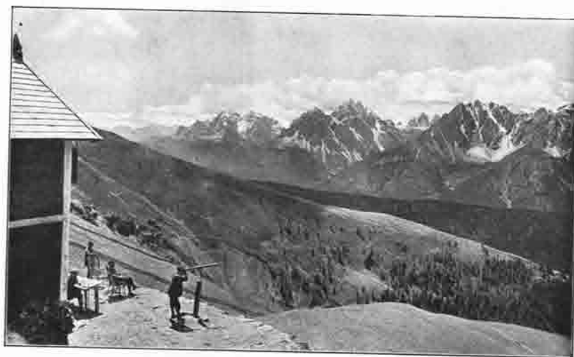
Blick von der Bonner Hütte am Toblacher Pfannhorn gegen die Dolomiten