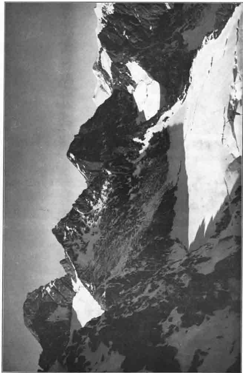
Blick von der oberen Säufsharte (3000 m, etwa eine Stunde nördl. von der Sütte) gegen Eichham (links), Segenkopf, Rainerhorn und Großenebiger