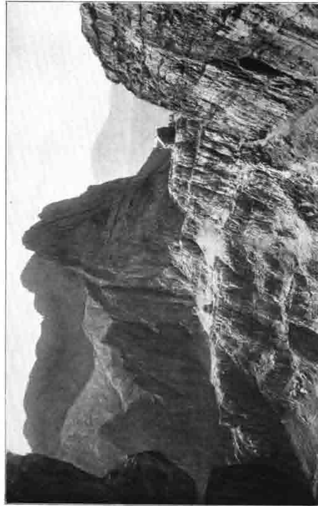
Bremer Haus an der Bocca di Brenta, Höhe: 2491 m