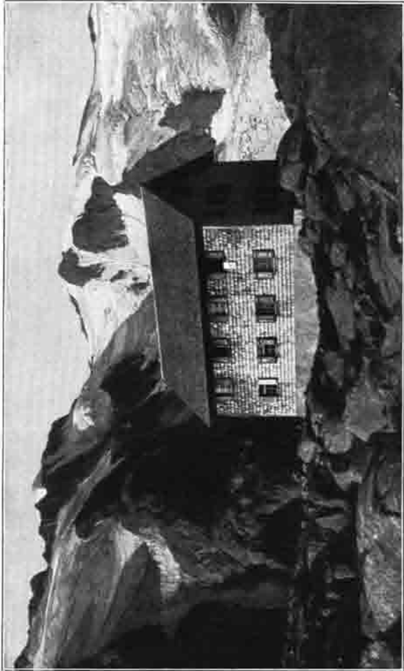
Bremer Hütte im Gschnitz, Höhe: 2390 m