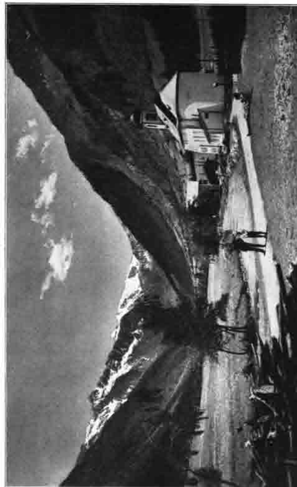
Kirche von Gschnitz im Gschnitztal

Gleich nach Gründung der Sektion setzte eine erfreuliche Vortragstätigkeit ein. Eigene Mitglieder berichteten teils über ihre Fahrten in die Alpen, teils erstatteten sie Referate über alpine Werke. Auch fing man an, mit den Nachbarsektionen in Fühlung zu treten, wie die 1892 unternommene Dampfer-