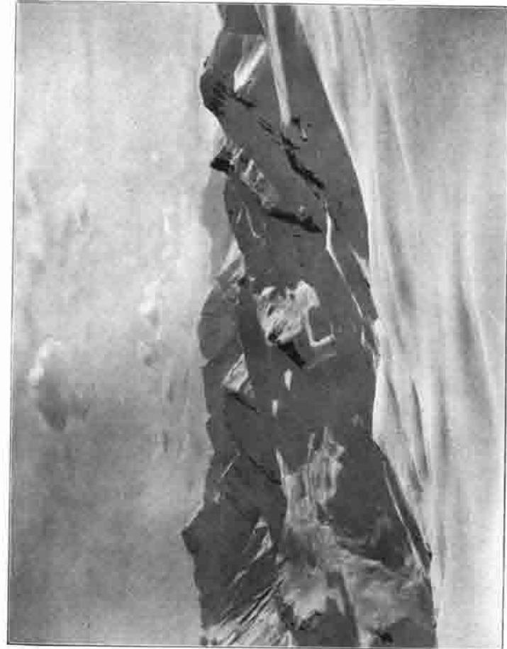
Fliesser Stieraspel (Samnaun)