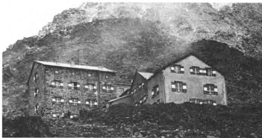
Hütte nach der Erweiterung 1978.