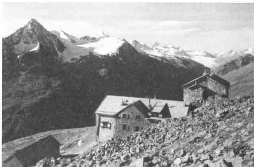
Breslauer-Hütte, 2840 m

Zur Einweihung dieses Anbaus und weiterer Ergänzungsarbeiten, die im Jahre 1929 durchgeführt wurden, lud die Sektion auf den 9./10. August 1929 ein. Auf 11 Uhr war die Hüttenweihe angesetzt; um 12 Uhr war dann eine Mittagstafel »gegeben von der Sektion«. Der Anbau hatte also die Sektion nicht umgeworfen, obwohl sie ihn aus eigenen Mitteln finanziert hatte.