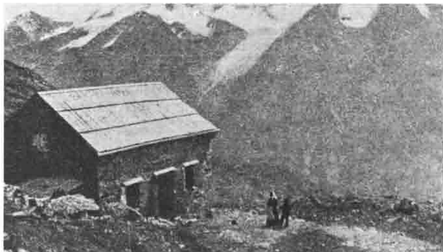
Alte Breslauer Hütte (1882–1896)

chen eindeutig in die Richtung der bergsteigerischen Touristik gestellt worden. Inwieweit hierzu auch Pfarrer Senn, dem das Wohl des Venter Tales als früherem Kuraten von Vent am Herzen lag, beigetragen hatte, kann nur vermutet werden.