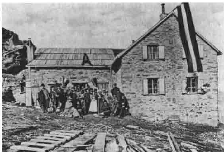
Einweihung der erweiterten Breslauer Hütte am 23. August 1896