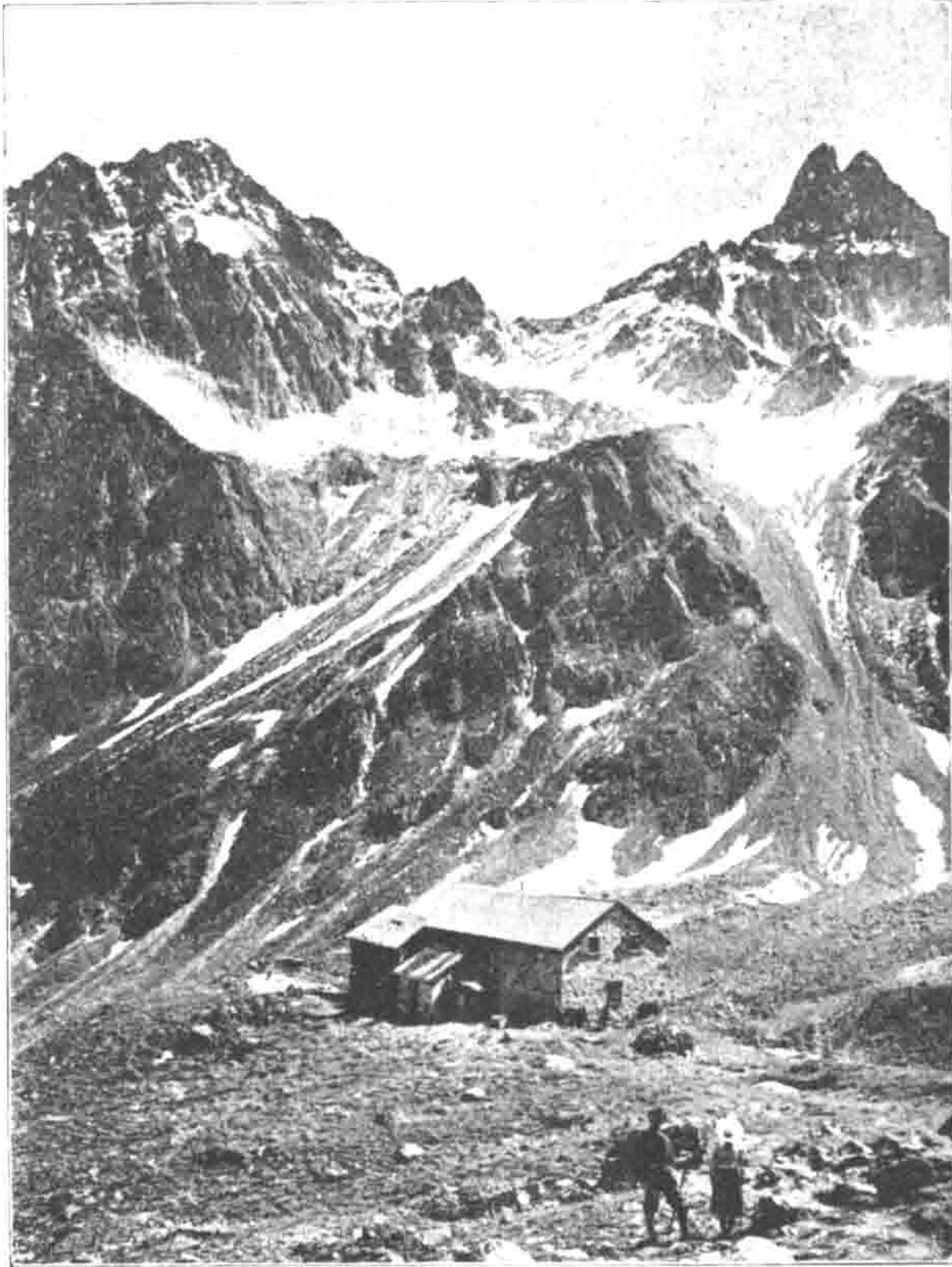
Darmstädter Hütte im Moostal bei St. Anton am Arlberg, 2380 m.