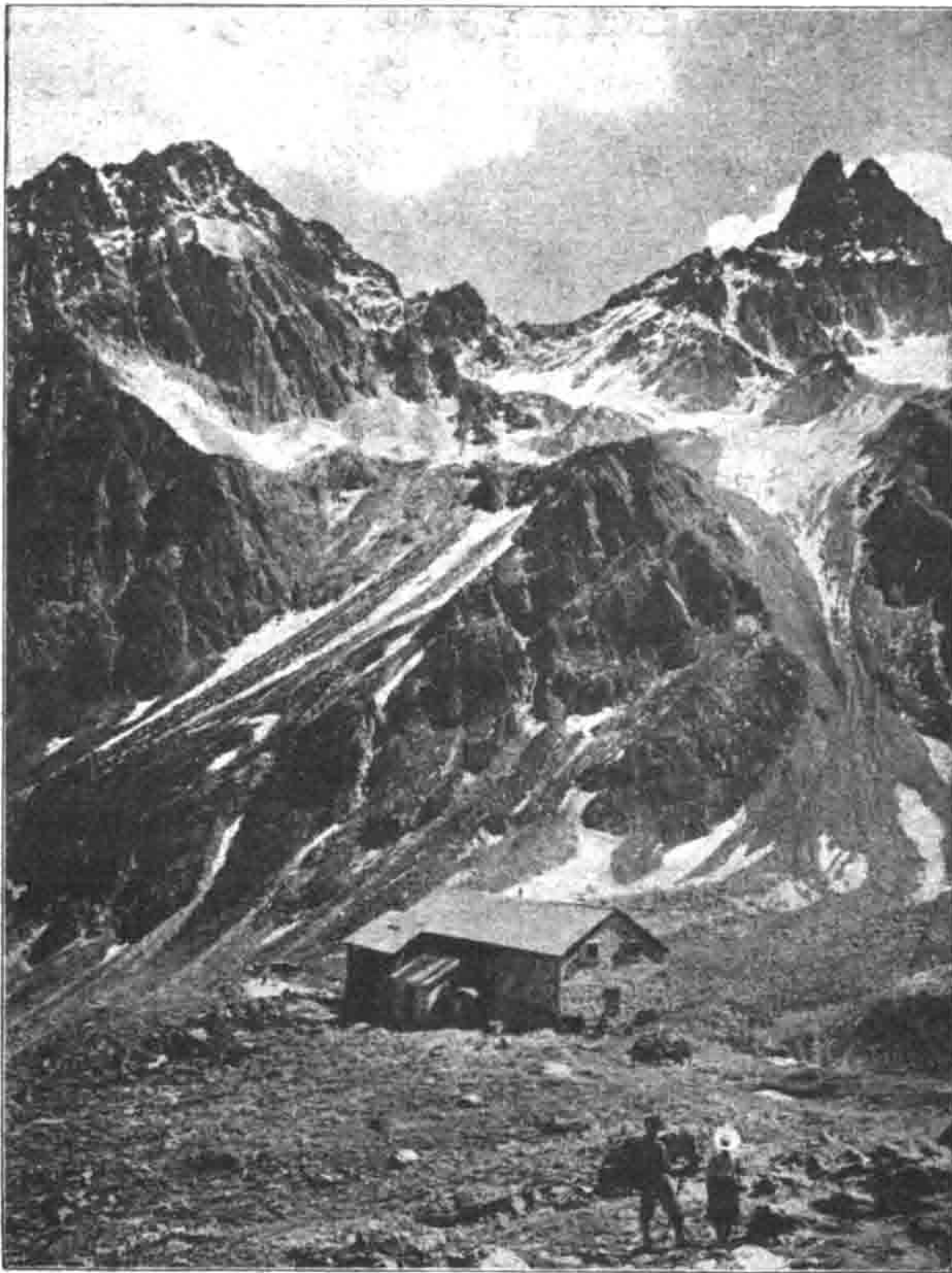
Darmstädter Hütte im Moostal bei St. Anton am Arlberg, 2380 m.