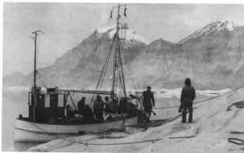
Ankunft 4. Juli 24.00 Uhr am Zielgebiet

Am 29. Juni 1975 flogen dann die 8 gut trainierten Bergsteiger in München-Riem über Kopenhagen nach Westgrönland ab. Nach der Landung in Søndrestrømfjord ging es am 1. Juli per Helikopter ca. 450 km nordwärts weiter bis Umanak. In Umanak konnte später der bereits zu Hause bestellte Kutter, ein Walfänger bestiegen werden. Wegen Schlechtwetter gab es in dem kleinen und netten Dorf Uvkusigssat kurzen Zwischenaufenthalt und dann ging es am 4. Juli weiter bis Nugatsiaq, dem letzten Stützpunkt. Dort wurde das vor wenigen Stunden vorher eingetroffene Hauptgepäck auf unseren Kutter "Ester" umgeladen und noch am gleichen Tag um 16.30 Uhr abends ging es weiter in den Karrat Isfjord Richtung unserem geplanten Basislager am Johannes Brae. Diese Fahrt 50 km ostwärts zwischen Eisbergen und -schollen hindurch war sehr aufregend. Um 24.00 Uhr erreichten wir das Ziel.