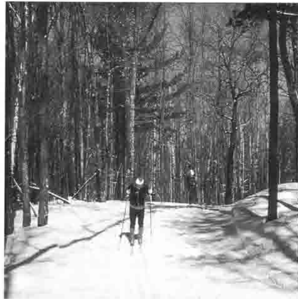
Loipe im Donauwörther Stadtwald.

Durch zahlreiche Skikurse auf dem Bock bei Harburg und am heimischen „Kalvarienberg“ sowie in den folgenden Jahren im Allgäu konnte vielen die Freude am Brettlsport vermittelt werden.