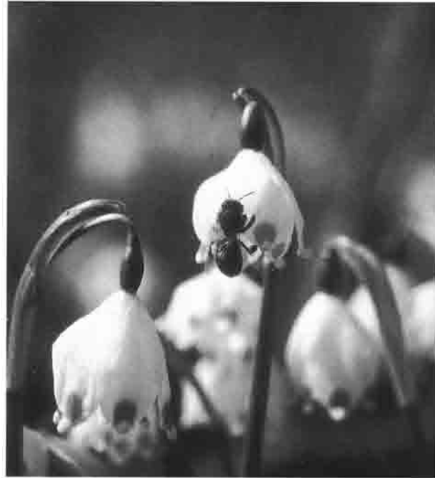
Der Schutz seltener Pflanzen und Blumen ist eine wichtige Aufgabe des Deutschen Alpenvereins.