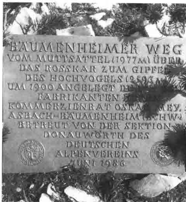
Erinnerungstafel an den Bau des Bäumenheimer Weges