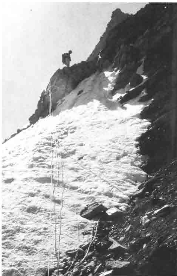
Gipfeleisfeld am höchsten Berg Südamerikas, dem 6960 m hohen Aconcagua in Argentinien

Schließlich neue Ziele, die Welt öffnet sich für Besteigungen in allen Ländern der Erde.