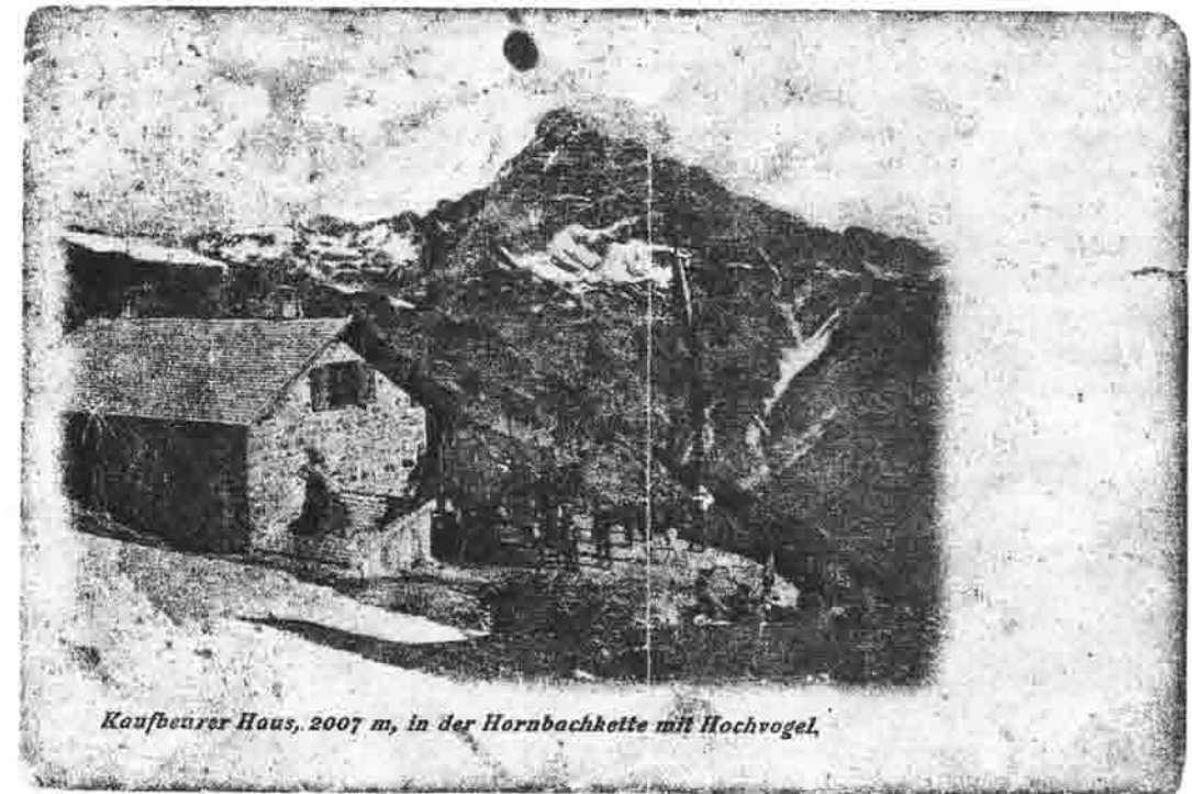
Kaufbeurer Haus, 2007 m, in der Hornbachkette mit Hochvogel.

Unerwähnt bleiben die Namen all jener Bergsteiger, die zum Teil die schwierigsten Bergtouren mit Schwierigkeitsgraden zwischen IV und VI am Hochvogel unternahmen. An klaren Herbsttagen besteigen heute mitunter über „300 Bergwanderer“ an einem Tag diesen herrlichen Aussichtsberg.