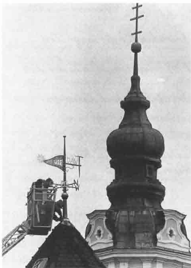
Montage der Wetteriahe auf dem Dach des Wasserturms im Jahre 1992