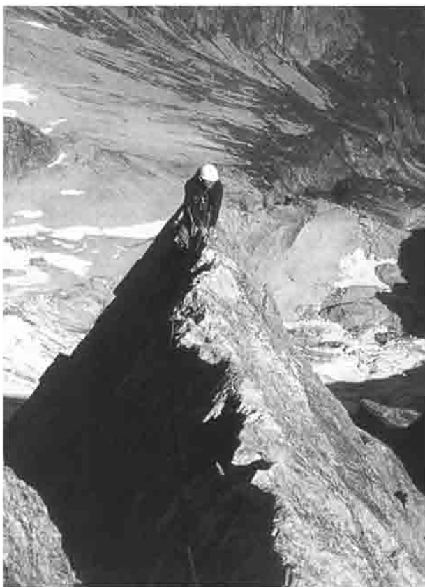
Kletterei an der Badile-Kante