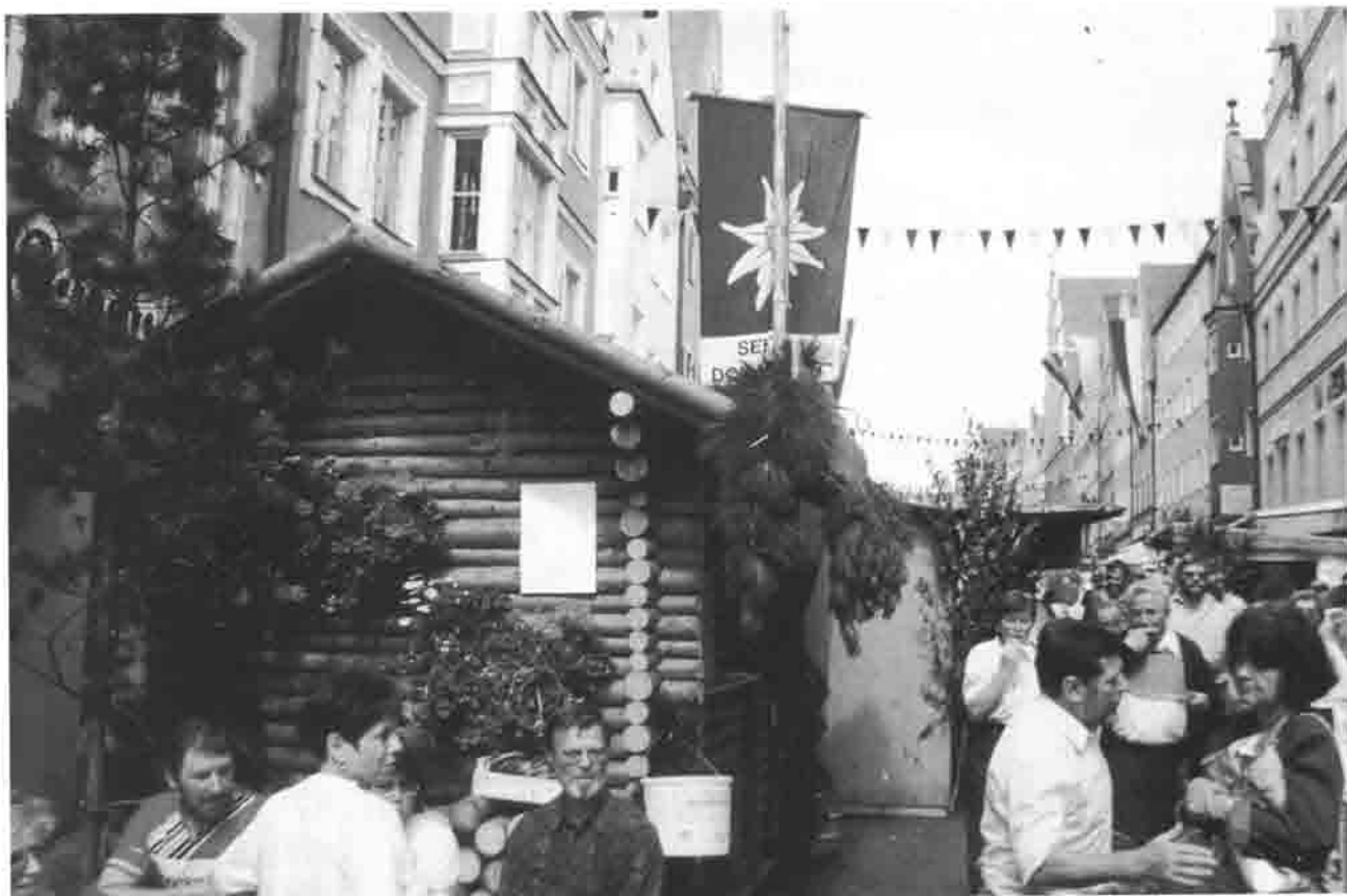
Im Jahre 1993 beteiligte sich die Sektion mit einem zünftigen Berg-Brotzeit-Stand am Donauwörther Reichsstraßenfest.