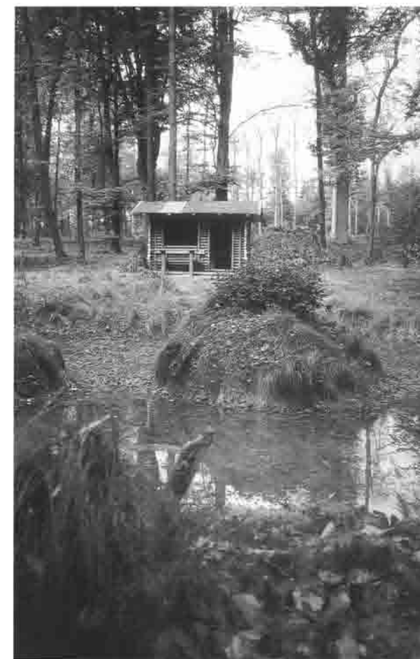
Feuchtbiotop am Edelweißweg im Donauwörther Stadforst – der Unterstand und das Biotop wurden von Mitgliedern der Sektion gebaut.