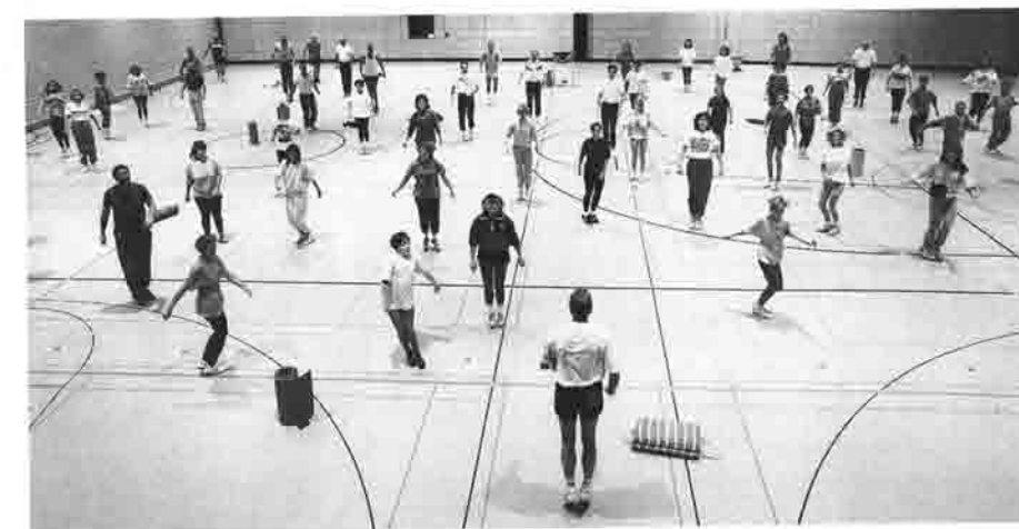
Seit dreißig Jahren Skigymnastik bei der Sektion Donauwörth.