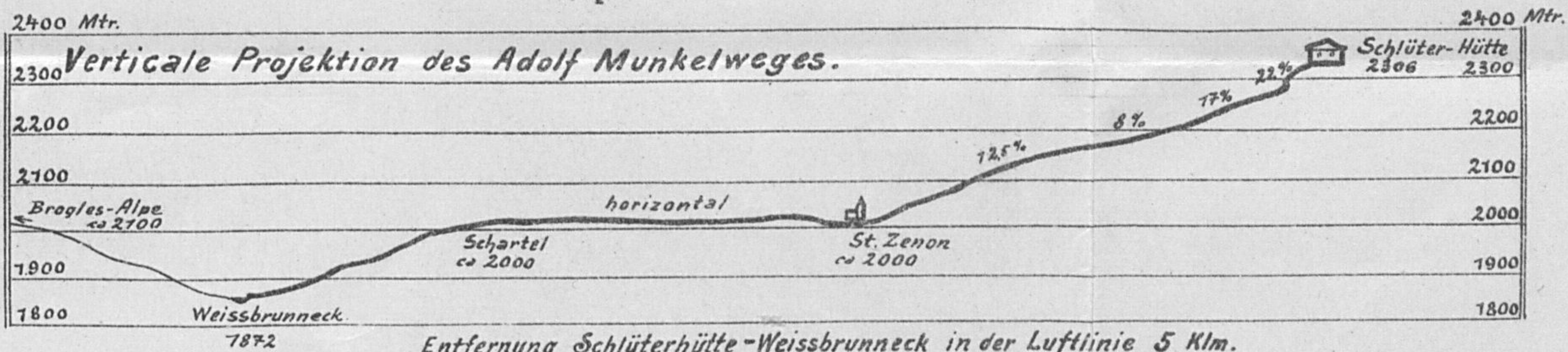
Entfernung Schlüterhütte-Weissbrunneck in der Luftlinie 5 Klm.