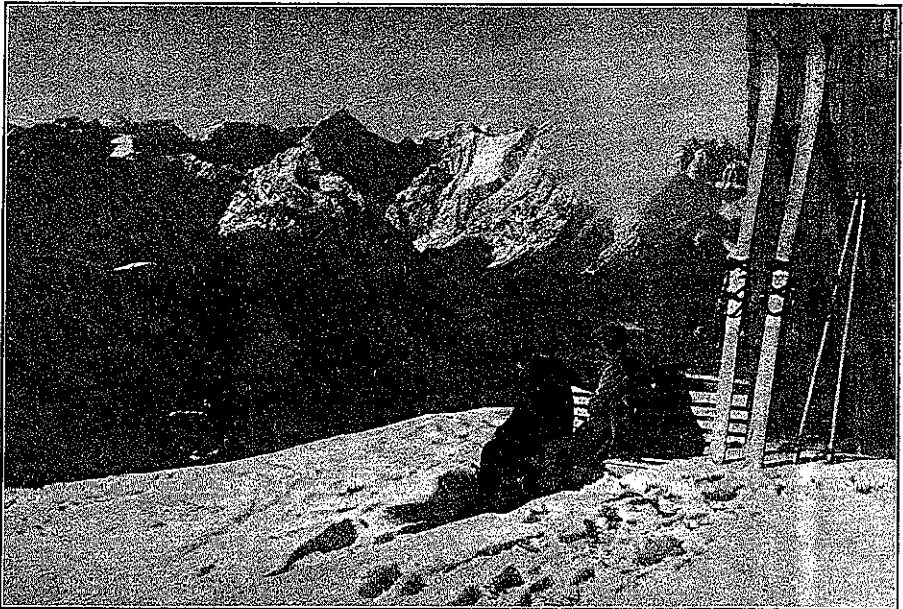
Die Erfurter Hütte im Wintersport

Erstattet vom Sektionsvorstand Erfurt 1928