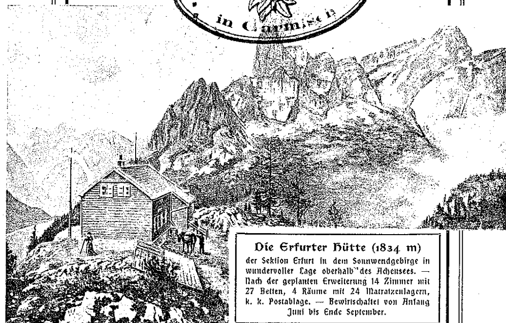
Die Erfurter Hütte (1834 m) der Sektion Erfurt in dem Sonnentendengebirge in wundervoller Lage oberhalb des Achensees. — Nach der geplanten Erweiterung 14 Zimmer mit 27 Betten, 4 Räume mit 24 Matratzenlagern, k. k. Postablage. — Bewirtschaftet von Anfang Juni bis Ende September.