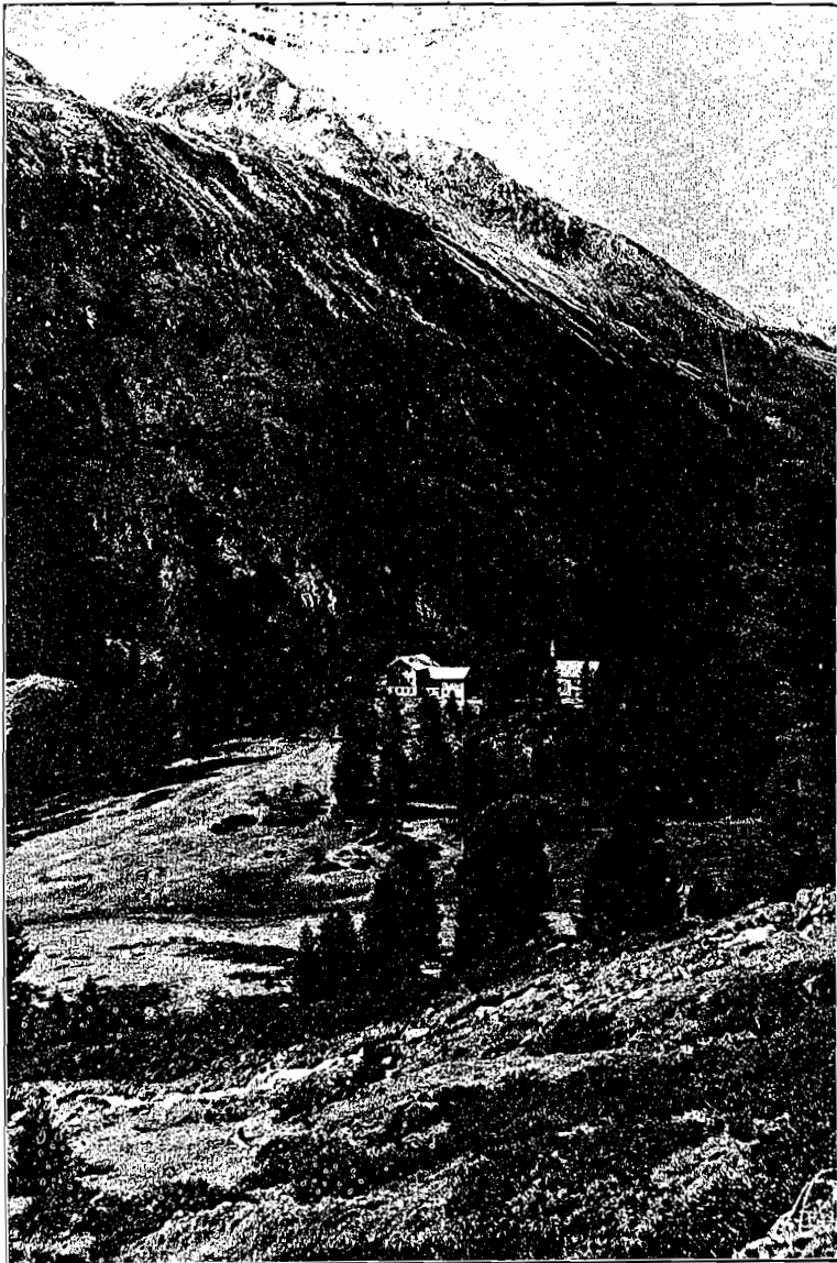
Im Gepatsch