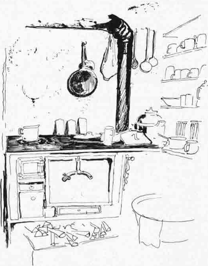
Küchenecke des kleinen Aufenthaltsraumes der Setzberghütte gez. Gulbransson

am 16. 3. 47. Es beteiligten sich 7 Damen, 5 alte Herren, 15 Herren und 6 Gäste. M. Gützel hat den Abfahrtslauf des Jahres 1951 mit flotten Strichen im Buch festgehalten. Wir bringen davon die Bildseite „Vorbereitung zum Abfahrtslauf“, wo sich „Blocki“ seine Doppeltgeschnürten von hilfreichen Händen zubinden läßt.