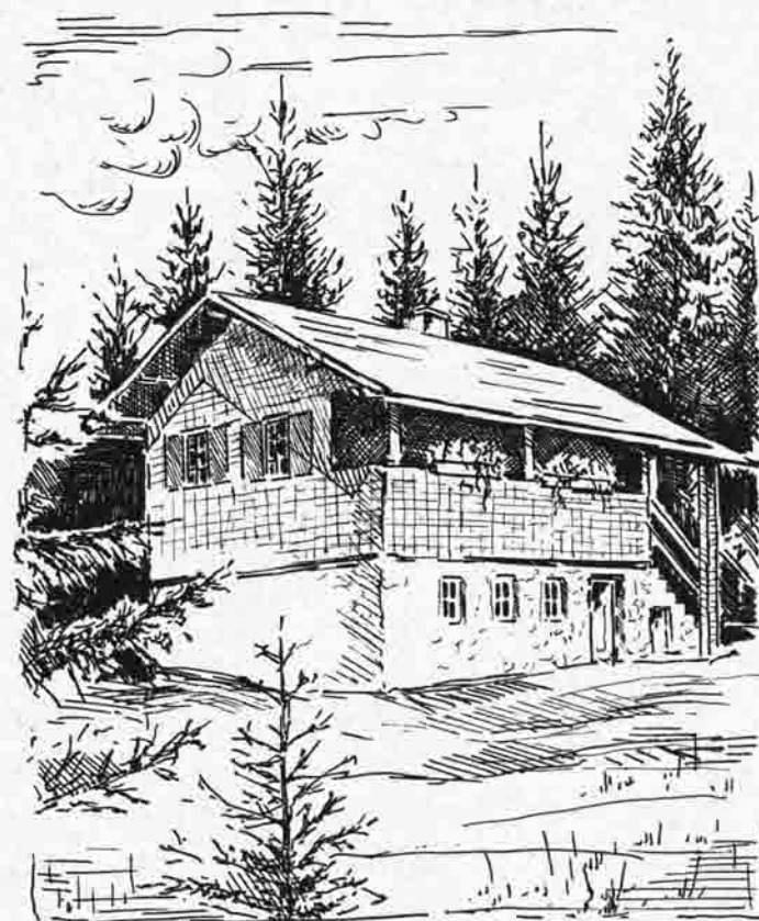
Längentalhütte gez. Hlerhager

Am 30. August 1953 war es schließlich soweit, daß ein LKW 30 Mann an den Arbeitsplatz befördern konnte, um das ganze Material von der Pfundalm zum Bauplatz zu schaffen. Einen Monat später konnte dann durch die Mithilfe der Handwerker das Richtfest gefeiert werden.