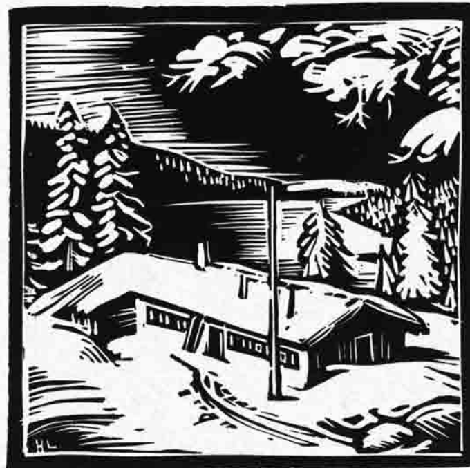
Setzberghütte nach Linoldruck von H. Landgrebe

Kanonofen und einen großen Küchenherd. Die Sektion verhandelte mit der Besitzerin, der Wallbergalpengenossenschaft und pachtete die ehemalige Almhütte. Unter großen Mühen, mit großzügiger Unterstützung vieler Mitglieder wurde sie im Laufe einiger Jahre zu einem gemütlichen Bergsteigerheim im Sommer und Winter und namentlich in den schlechten Nachkriegs-