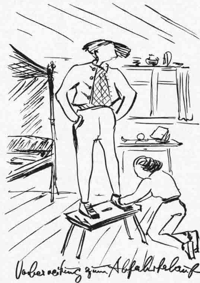
gez. Margot Gützel

Ulkiye Zeichnungen mit Spottversen sind vielfach den Arbeits- und Holzkommandos gewidmet. Wieder andere befassen sich eine Zeit lang mit bestimmten Familien (z. B. Dr. Sachs), die einige Jahre hindurch die Hütte häufig