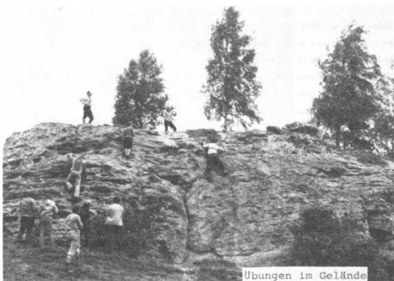
Übungen im Gelände