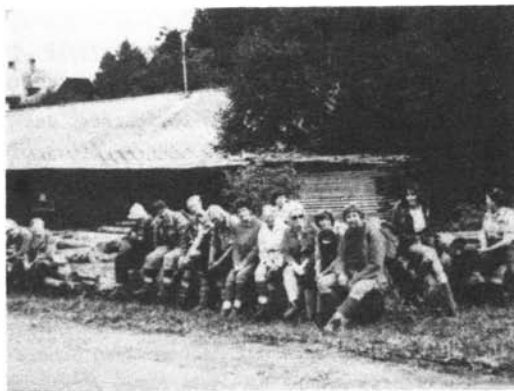
Die " Hochgebirgler "