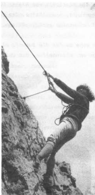
Lockerheit am Seilgeländer Steinberg/Scharzfeld

Im Frühjahr 1979 wollte ich nun hier in Göttingen erstmals mit einem Grundkurs über das Verhalten im Gebirge einen zaghaften Versuch starten. Die Resonanz stellte all meine Erwartungen in den Schatten - nur auf eine kleine Zeitungsnotiz hin saßen den Referenten an den sieben Schulungsabenden zwischen 60 und 80 Interessenten gegenüber. Dabei konnten wir etwas Erfreuliches feststellen: Unsere Mitglieder sind fast alle bestens auf das Hochgebirge vorbereitet - 3/4 der Lernbegierigen rekrutierten sich aus Nichtmitgliedern. Hoffentlich stimmt meine Annahme!