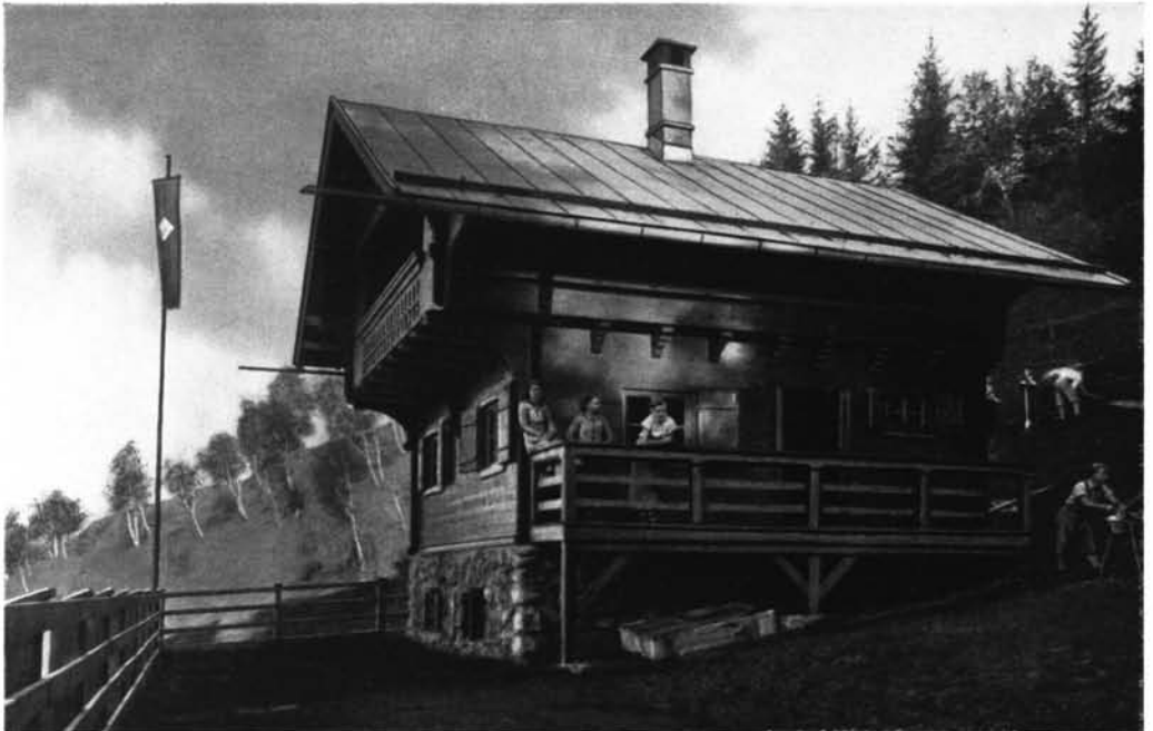
Vinzenz-Tollinger-Jugendbergheim am Tullerberg, 1208 Meter