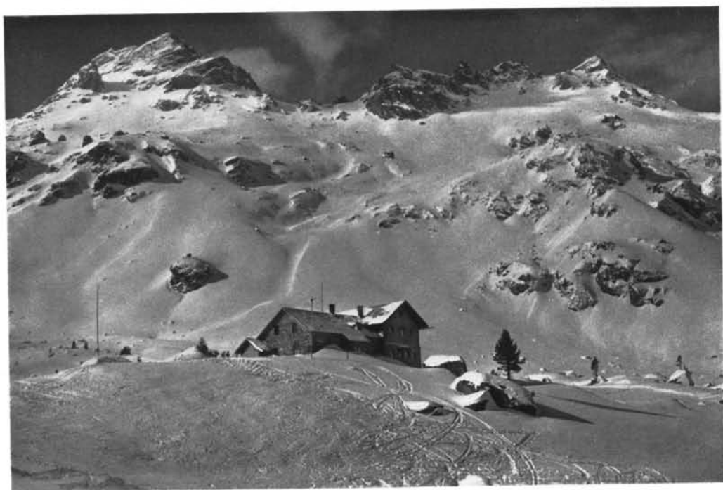
Lizumer Hütte, 2050 Meter, mit Sonnenpitze und Tarntaler Köpfen