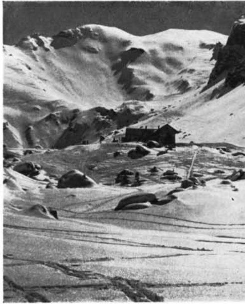
Lizumer Hütte gegen Plüderling