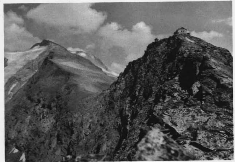
Hannoverhaus auf der Arnoldhöhe

Nun kam das vierte. Nach sehr schlimmer Winterzeit endlich Baderuhe! O nein! War das Niedersachsenhaus nunmehr so zu sagen in Reih und Glied eingestellt, so mußte heuer das Hannoverhaus ver-