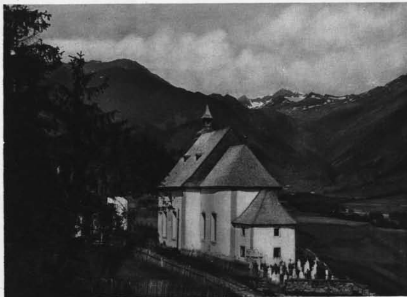
Ridnaun in Südtirol gegen Becher