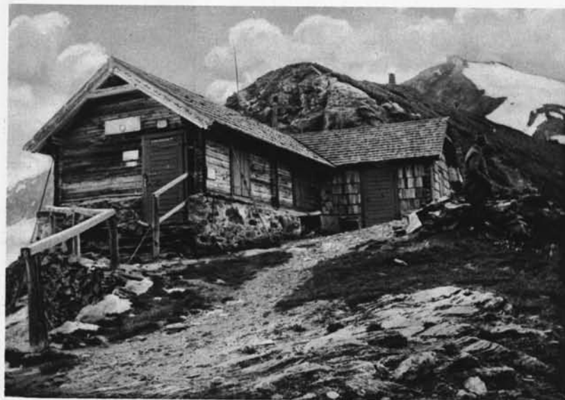
Hannoverhütte auf dem Elschfattel