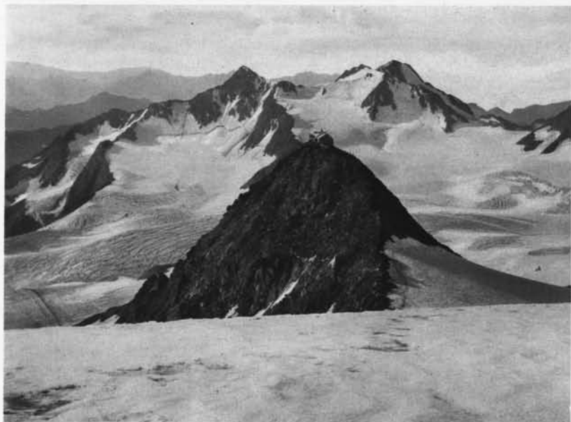
Kaiserin-Elisabeth-Haus auf dem Becher

„Ich beneide diese Jugendkraft und kann immer noch nicht an die 75 Jahre glauben.“