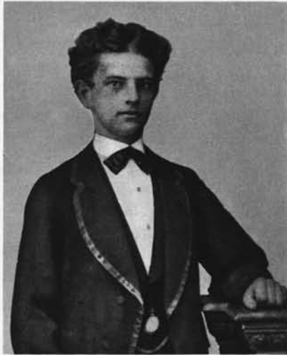
Jugendbildnis des Jubilars 1870

Ein Jubeltag für die Sektion, für alle seine vielen Freunde! Freilich, wir hätten ihn viel lieber um 10, um 20 Jahre jünger; er sich selbst wahrscheinlich auch. Aber das geht nun einmal nicht, und so preisen wir ihn und uns glücklich, daß er, ein Jüngling an Begeisterungsfähigkeit, ein Bergsteiger noch heute wie wenige, nunmehr im 43. Jahre seiner Führerschaft der Sektion in ungebrochener Kraft unter uns lebt.