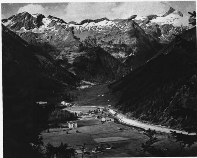
Mallnitz in Kärnten gegen Ankogel