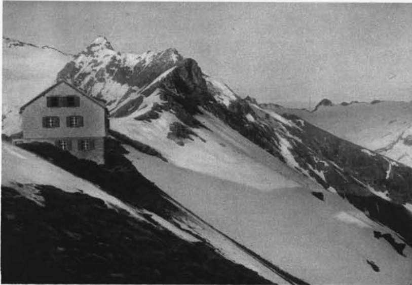
Niedersachsenhaus auf der Riffelscharte bei Bad Gastein