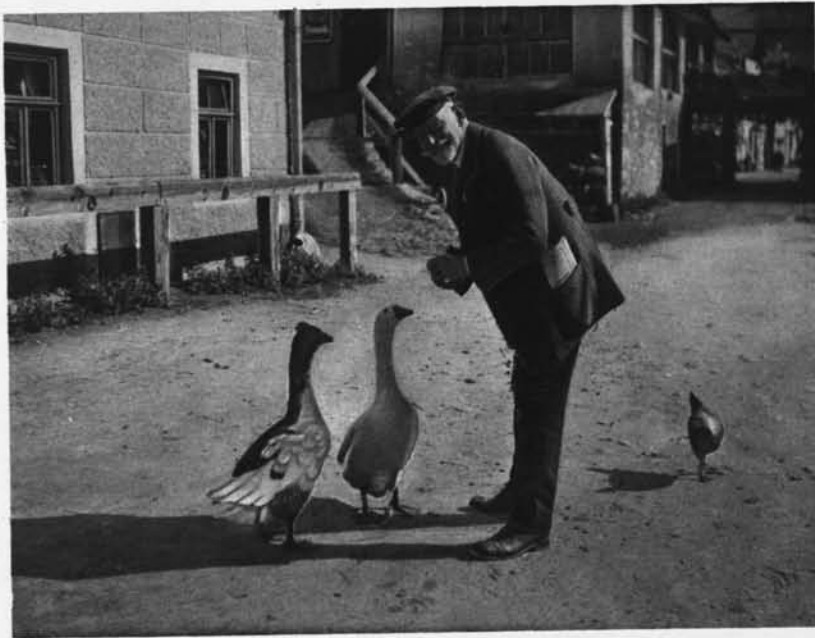
Arnolds Lieblinge vor den „Drei Gemfen“ in Mallnitz

„Grüß Gott! bis 14. Januar, Herr Unlustig!“