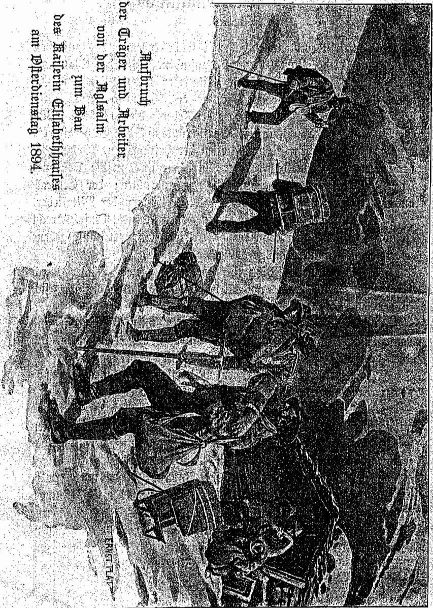
Aufbruch der Träger und Arbeiter von der Faglwalm zum Bau des Kaiserin Elisabethbaues am Pferdviertel 1894.