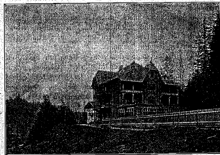
Gasthof zum Sonklarhof in Bidnaun.