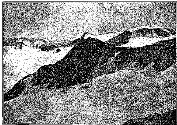
Beshergipfel vom Rothen Grat aus.