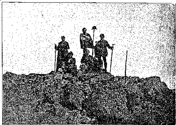
Beshergipfel im August 1893.