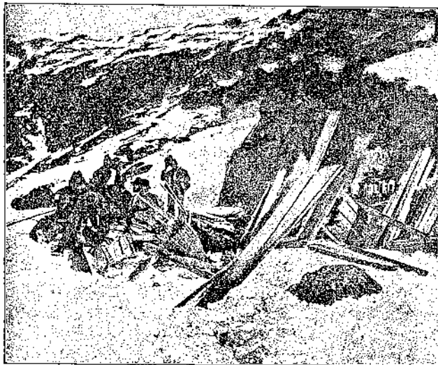
Transport von Baumaterial für den Erweiterungsbau des Becherhauses im Jahre 1903.