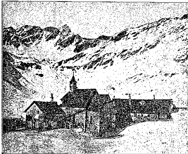
St. Martin am Schneeberg. 2356 m hoch gelegen, 4 St. von Ridnaun, bequemster Ausgangspunkt für die Besteigung des Bechers (850 m, Aufstieg in 3 Stunden).