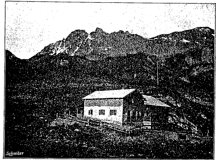
Heidelberger Hütte im Fimbertal, 2300 m.