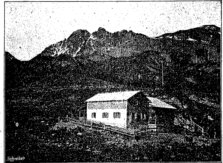
Heidelberger Hütte im Fimbertal, 2300 m.