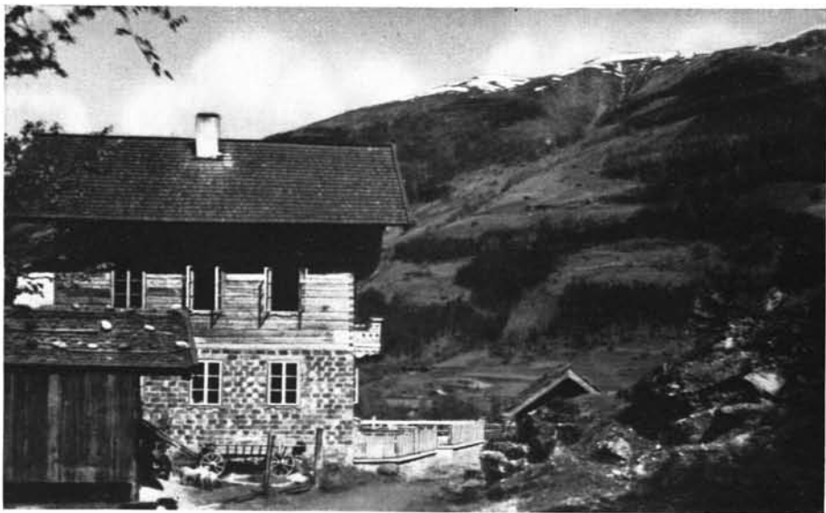
„Alpengasthaus zur Klause“ am Eingang des Habachtals