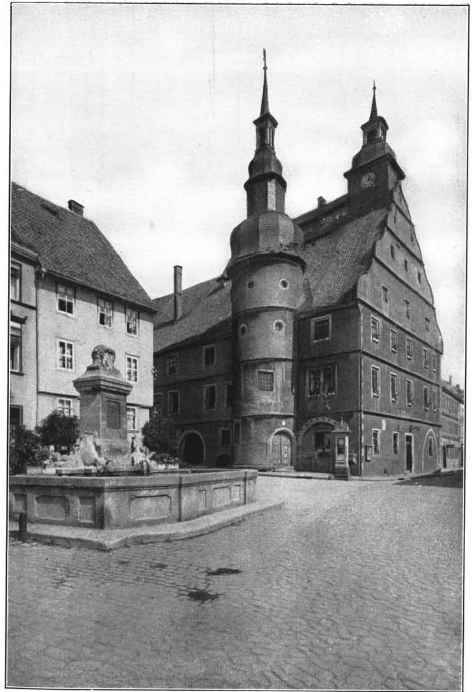
Die schöne Kleinstadt Hildburghausen im südlichen Thüringen, dem grünen Herzen Deutschlands

Möge ein gütiges Geschick über unserer Hütte walten und sie bewahren vor Schäden, wie sie beim Tosen der Elemente in den Höhenregionen entstehen können. Vor allen Dingen aber hoffen wir, daß unser Heim bald aus seiner Vereinsamung erlöst werde. Wir erwarten mit Sehnsucht den Tag, an dem wir wieder mit Rucksack und Eispickel vom Pinzgau hinaufsteigen können ins Gebiet der Thüringer Hütte, ins Reich unserer Träume!