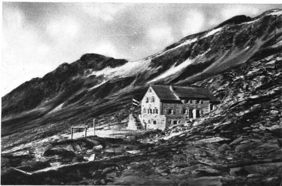
Die „Thüringer Hütte“ im Benedigerggebiet (2400 m)