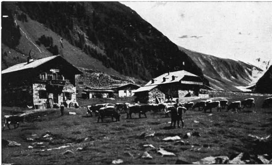
Mittleres Habachtal mit „Alpenrose“ und „Edelweiß“

Kommt, ihr Thüringer, zu unserem schmucken Heim in den Bergen des schönen Tauernlandes! Laßt dahinten die Sorgen des Alltags und steigt auf die Höhe, wo das Herz leicht und der Sinn frei wird. Dort droben werdet ihr gar bald neue Spannkraft des Körpers fühlen, neuer Tatendrang wird euch beglücken und selige Erinnerung, dies Paradies des Menschengewisses, wird euch begleiten, wenn ihr wieder heimwärts zieht in die Thüringer Wälder!