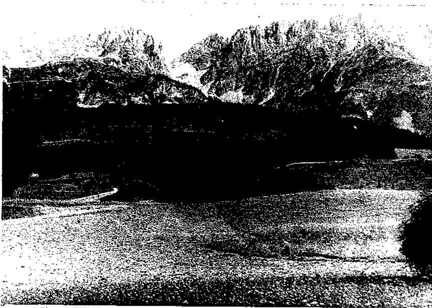
Wilder Kaiser von Süden.