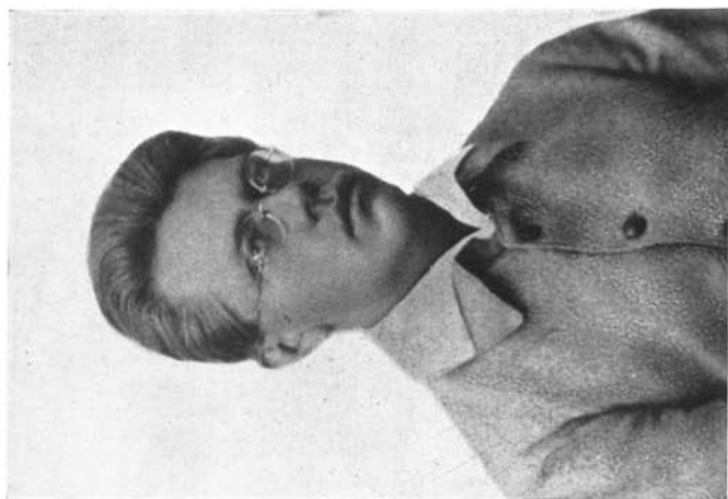
phil. Oskar Lange † 27. Juni 1926