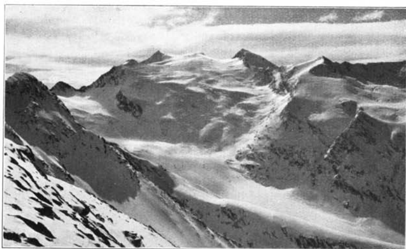
Blick von der Hohen Mutt auf Rotmoos- und Wasserfallferner sowie Rotmooskogel und mittleren Seelenkogel