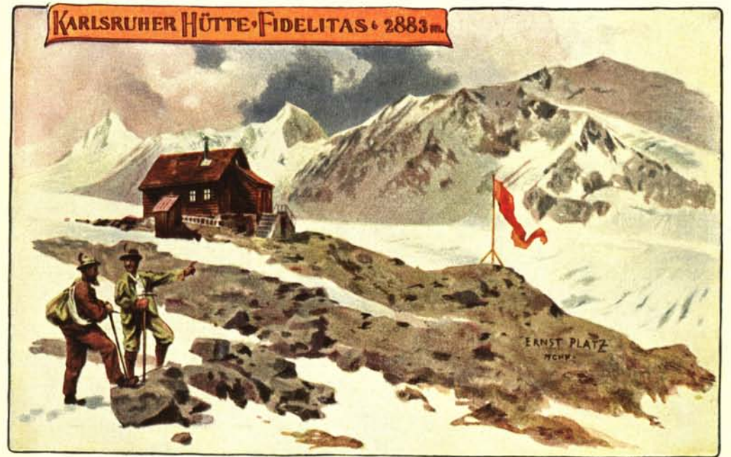
Fidelitas-Hütte am Steinernen Tisch bei Obergurgl

Nach d. Aquarell von Ernst Platz, etwa 1896 (vgl. Text)