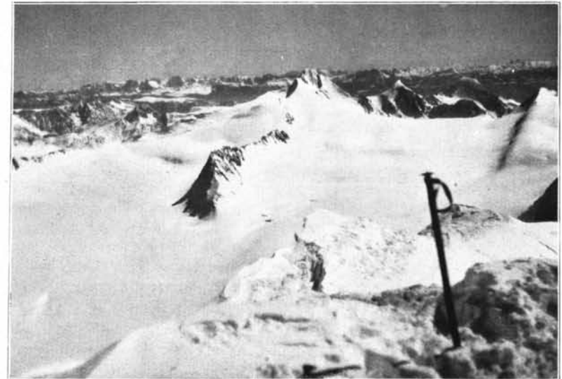
Blick vom Schalkkogel auf Gurgler Gletscher, Mitterkamm, Hochwilde und Texelgruppe. Im Hintergrund die Dolomiten