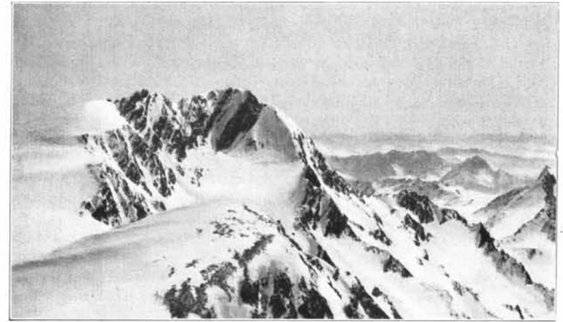
Blick von der Falschungspitze auf den Hochwildegrat