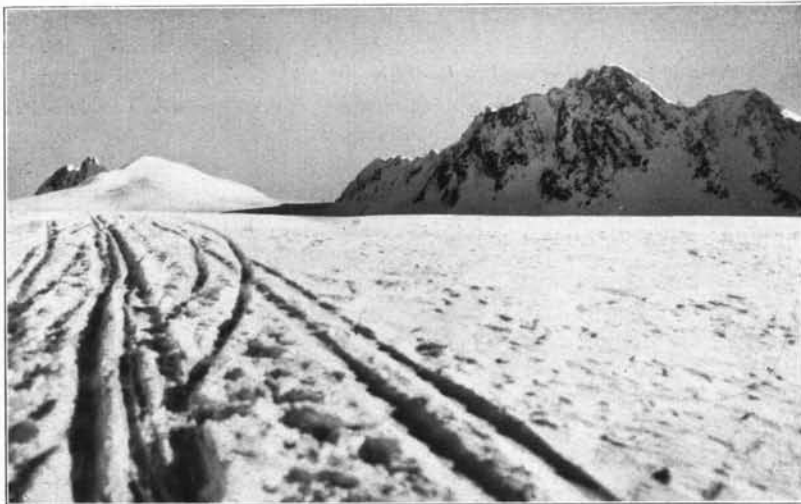
Mitterkamm, Annakogl und Hochwilde