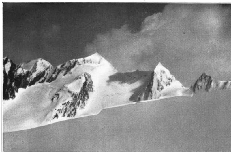
Blick vom Wasserfallferner auf Liebenerspitze, Trinker- und Häuflerkogel