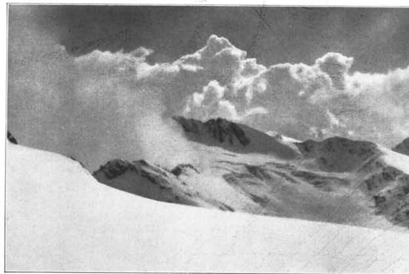
Blick vom hinteren Seelenkogel auf den Hochwildegrat

Das Gletschertal weist dort eine Verbreiterung auf und außerdem fällt offensichtlich der Gletscherboden dort steil ab. Die Folge davon ist, daß sich ein wunderbar anzuschauendes Spalten- und Brüchegewirr gebildet hat. Besonders fesseln das Auge die im Sonnenlicht grünlich und bläulich schillernden schneefreien Eiswände der großen Brüche. Die Spur wird hinüber gelegt an den linksseitigen Rand des Gletschers; in einer schmalen Rinne wird die Steilstufe überwunden. Längst ist man schon wieder höher als das traute Heim am Langtaler Eck, zu dem der Blick immer und immer wieder sich zurückwendet. Doch bald entschwindet es nun den Augen. Das Ramolhaus grüßt aus seiner stolzen, luftigen 3000 Meterhöhe von jenseits herüber. Es hält noch seinen Winterschlaf, denn unzugänglich ist es in