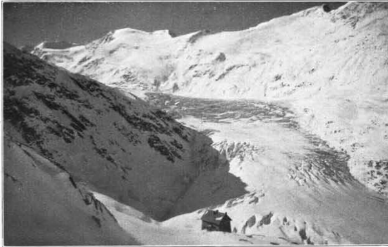
Langtaler Eck Hütte mit Gurgler Ferner