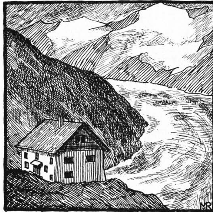
Karlsruher Hütte am Langtalereck (2450 m) bei Obergurgl, Öztaler Alpen