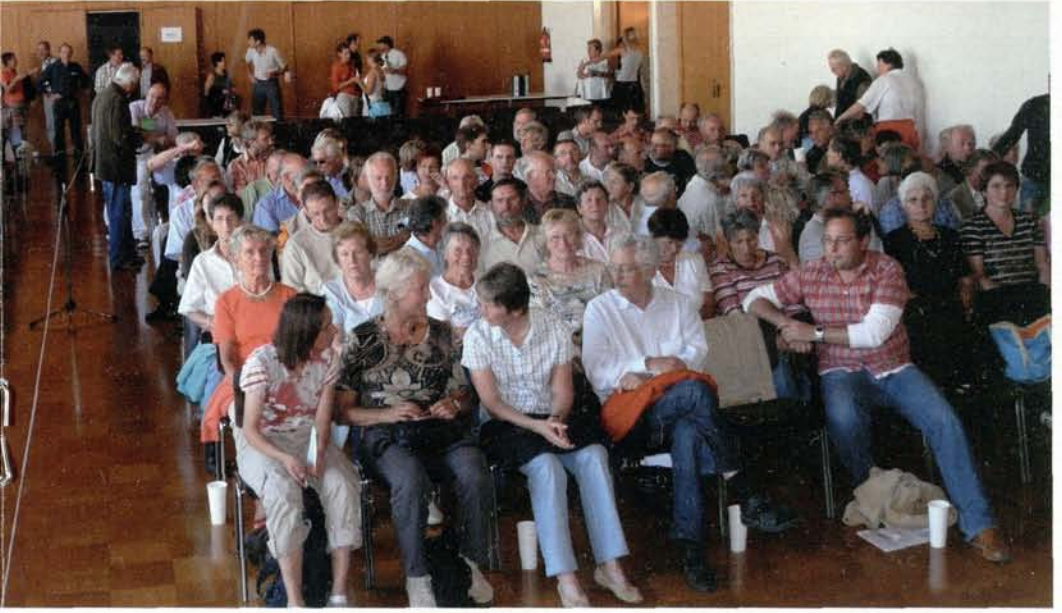
Fusion der DAV-Sektion Gablonz und der DAV-Sektion Kaufbeuren im Jahr 2008