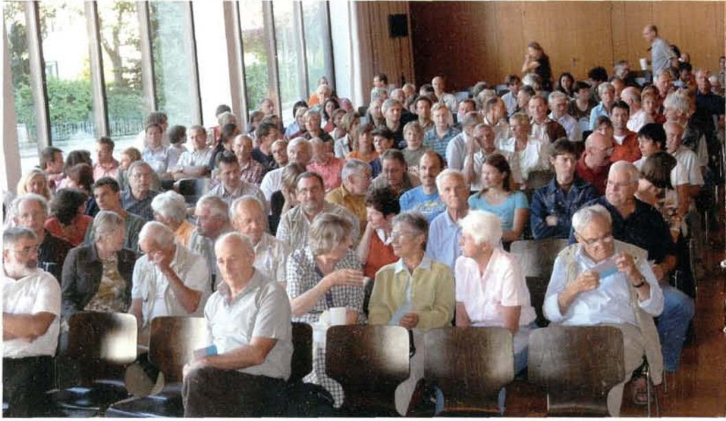
Fusion der DAV-Sektion Kaufbeuren und der DAV-Sektion Gablonz im Jahr 2008