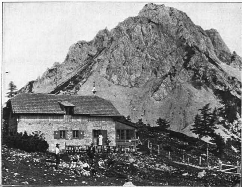
„Klagenfurter Hütte“.