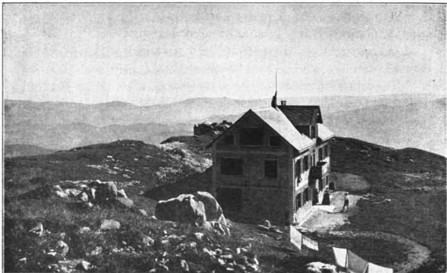
Das „Ursulaberg-Haus“