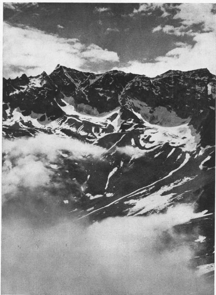
Aus dem Zeischtal dem neuen Arbeitsgebiet der Sektion Blick vom neuen Weg auf Kluppen und Kluppenferner