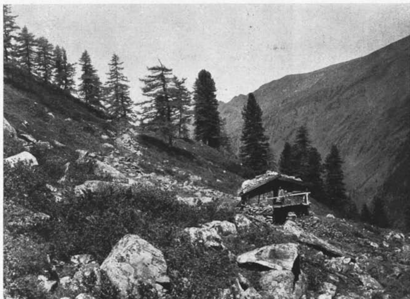
Die Zeischalpe mit ihren schönen Lerchen und Zirben