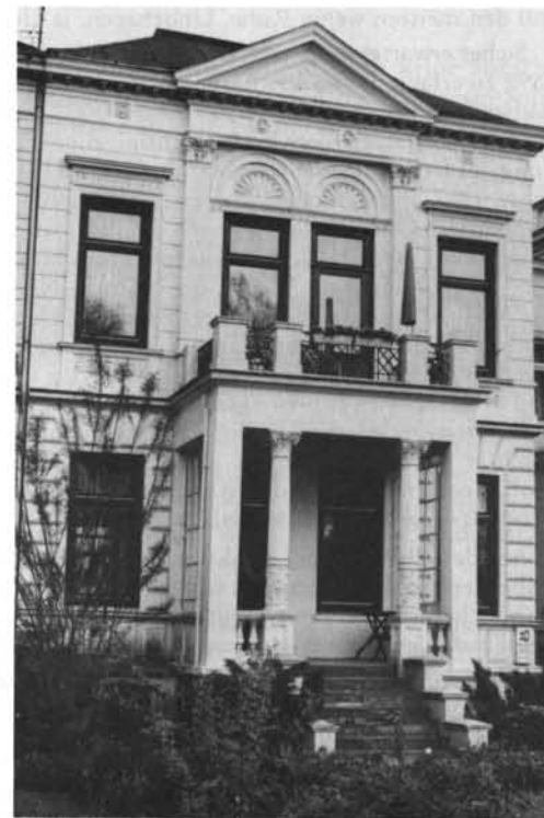
Auf der rückseitigen Gartenterrasse des Hauses Am Burgfeld 12a wurde am 2. Juni 1892 die Sektion Lübeck des DAV gegründet.

—22° mit drei Führern den Montblanc bestieg, die kleine auf der Schneecalotte des Gipfels auf Veranlassung J. Janssens errichtete Holzhütte in gutem Zustand gefunden habe; eine merkliche Lageveränderung derselben wurde nicht wahrgenommen. Am 30. November (Heft 22) wird dann mitgeteilt: „Herr Janssen beharrt auf seinem Plan, auf dem Gipfel ein Observatorium zu errichten“, und im letzten Heft dieses Jahrgangs 1892 findet sich die Notiz, daß die Hütte, die Herr Janssen auf der Schneecalotte des Montblanc errichten läßt, aus Holz bestehen wird und bei einer Höhe von 7-8 Metern bis zur Mitte im Schnee vergraben und gegen Blitzgefahr mit einem feuersi-