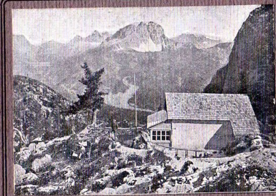
Pfalzgauhütte gegen die Drei Zinnen.