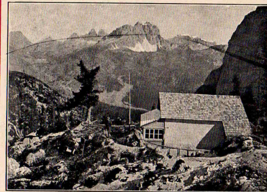
Pfalzauhütte gegen die Drei Zinnen

Deutscher und Österreichischer Alpen-Verein · Sektion Pfalzgau Mannheim-Ludwigshafen am Rhein