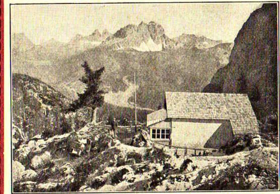
Pfalzgauhütte gegen die Drei Zinnen

Hofbuchdruckerei Max Hahn & Co. Mannheim