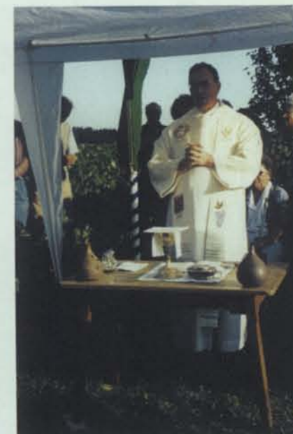
Feldmesse am Alpenvereinskreuz

gliedern zahlreiche Zugangsmöglichkeiten.