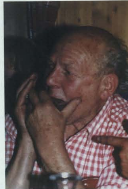
Hüttenabend mit Freunden