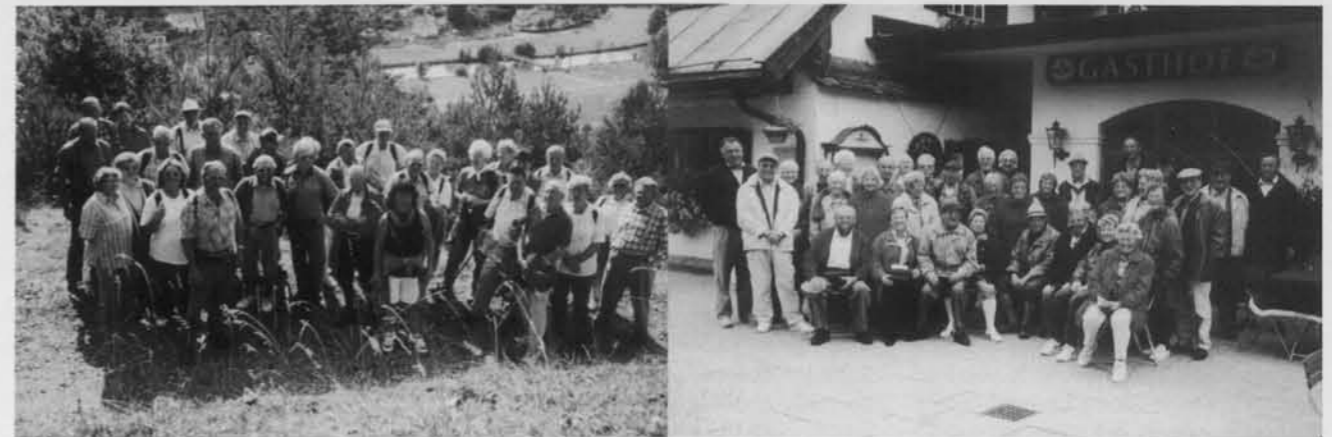
Senioren im Altmühltal

Speisekarten aufgelegt hatte. Zum Abschluß und Ausklang des Wanderprogrammes 1999 besuchten die Senioren das Kloster Ettal. Hier erfuhr man, wie der bekannte Likör hergestellt wird. Das Brauereimuseum wurde besichtigt und auch eine Führung durch die Klosterkirche war dabei. Die "Blaue Gams" sorgte fürs leibliche Wohl und der Rundweg um Ettal für die Verdauung, bevor der Ausflug ausklang. Die Senioren des Meringer Alpenvereins hatten insgesamt 664 Teilnehmer bei Stammtischen und Wanderungen und viele haben aktiv beigetragen, dass alles reibungslos verlaufen konnte. Ihnen gilt ein besonderes Dankeschön. Auch im Jahr 2000 werden sich die Senioren an jedem dritten Montag im Monat im Aufenthaltsraum an der Kletterwand treffen.