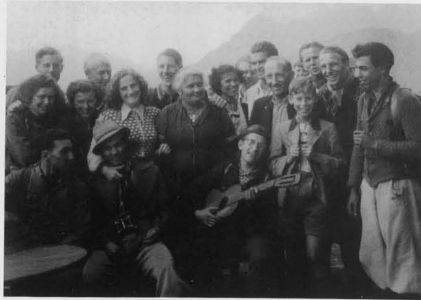
1950 auf der Mittenwalder Hütte

beziehen konnten. Da reifte nicht aus Idealismus, sondern aus Ärger der Entschluß, in diesen Verein gehen wir auch. Dass dies aber leichter gesagt als getan war, mussten wir schnell erfahren. Die nächste Alpenvereinssektion war in Augsburg. Adresse erfragt, hingefahren und die Absicht bekundet, in den Verein einzutreten. Es war der von der Militärregierung der Amerikaner neu genehmigte Alpenclub. Da bekamen wir zu hören: "Ja, dazu braucht jeder zwei Bürgen". Sauber, such mal einen Bürgen, wenn dich keiner kennt und der für deinen Leumund dann gerade stehen soll. Aber auch diese Klippe wurde umschiff und ab 1947 waren wir also Alpenvereinsmitglieder. Doch richtige Mitglieder der Sektion Augsburg sind wir nie geworden. Die hatten ihre Gruppen, in denen man kaum Fuß fassen konnte. An den Fahrten konnten wir nicht teilnehmen, weil der Anschluss zu den Frühzügen nicht so klappte. Bei den Vorträgen mussten wir immer vorher