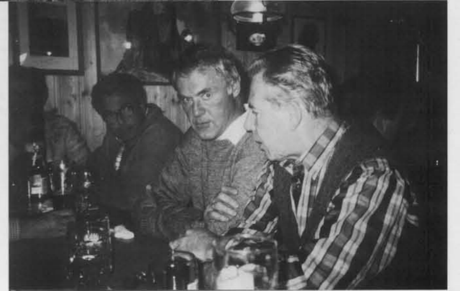
Mit Bergkameraden der Nachbarsektion Geltendorf