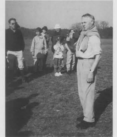
Bei der Sektion Geltendorf

das Vereinsjahr 1999 feierlich ausklingen.