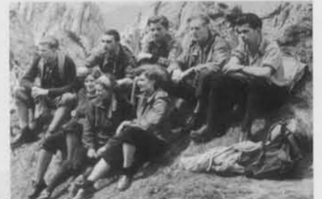
1952 im Karwendel

nommen und fortgeführt. Schon seit den 60iger Jahren schrieben sich Mitglieder der Sektion Extremtouren in den Walliser Alpen, in der Mount Blanc-Gruppe und im Kaiser ins Tourenbuch. Auch in den Folgejahren waren es Vereinsangehörige, die auf Bergen wie Monte Rosa, Lyskamm, Dom, Weißhorn oder Matterhorn standen. Der Bochettiweg und der Orsiweg in der Brenta wurden begangen und so manche Ferrata in den