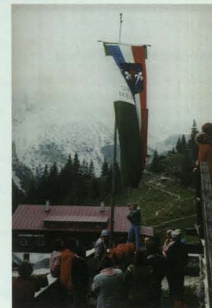
Bei der Sektion Friedberg in den Tannheimern

Junioren des Jahrganges 1973 werden A-Mitglieder, die Jugend des Jahrganges 1982 wechselt zu den Junioren und die Kinder des Jahrganges 1985 werden Jugendbergsteiger.