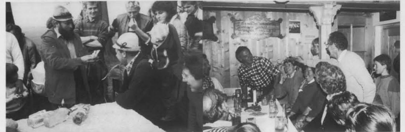
Wandern auf heimischer Flur