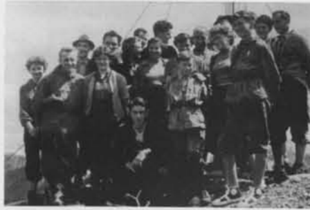
Auf der Roten Flüh 1954

Zu den Marksteinen im gesellschaftlichen Leben des Vereins gehört der Edelweißabend. Der erste fand bereits 1952 statt. Seit 1967 gibt es die Bergsteigermette in St. Franzisk. Auch die Vorweihnachtsfeier der Sektion ist Tradition. Jahrelang gab es einen Faschingsball. Und die Meringer Bergsteiger unterhalten freundschaftliche Kontakte u.a. zu der Sektion Friedberg, und mit der Sektion Geltendorf verbindet nicht nur die Patenschaft, sondern eine über Jahre hinweg gewachsene Bergkameradschaft, die in gemeinsamen Wanderungen ihren Ausdruck findet. Für eine Gruppe von Fotofreunden war die Lechrainhütte zehn Jahre lang beliebter Treffpunkt. Daraus ergaben sich