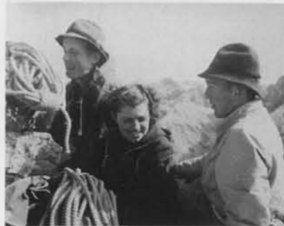
Jugend in den 50er Jahren