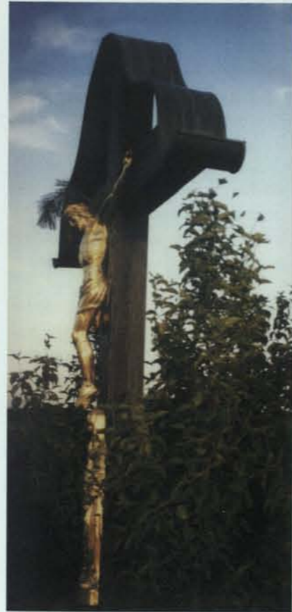
Alpenvereinskreuz am Gidiweg

schlossenheit dem Schönen gegenüber. Engagierte Bergsteiger kennen keine Randalen, keine Drogen, kein zerstörerisches Wirken, sie sind wertvolle Mitglieder einer Gemeinschaft, die in Toleranz und Friedfertigkeit miteinander lebt.