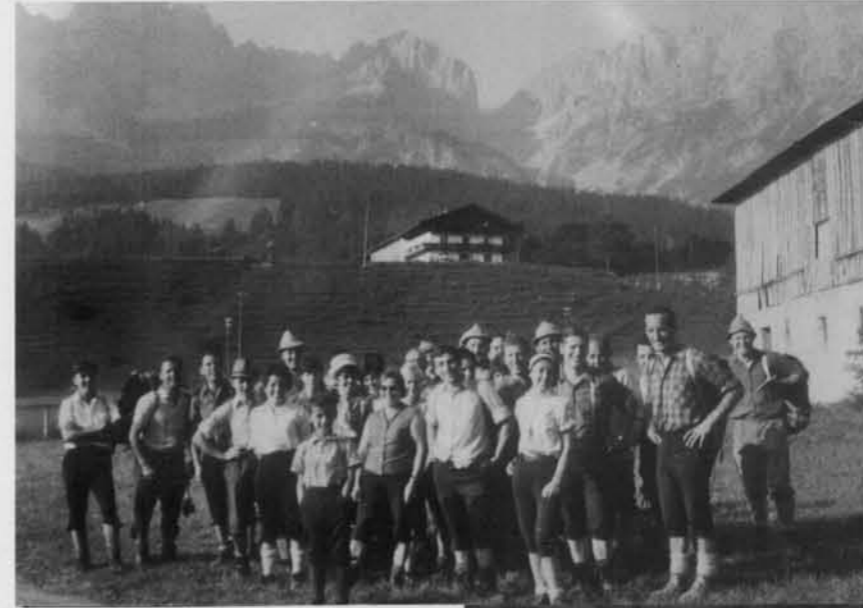
1969 im Wilden Kaiser

Dem Glücksfall Nr. 3 ist es zu verdanken, dass die Sektion eine große rührige Jungmannschaft bekam, die das Vereinsleben beflügelt hat. Unser Traum von einer eigenen Hütte bei der Höfener Bergbahn, wo der Platz ausgesucht wurde und die Grundstückssache mit dem Besitzer schon geklärt war, hatten uns die Jagdherren leider verbaut. Die Jungmannschaft hatte dann zwar keine Berg-, aber die Lechrainhütte in der Friedenau ermöglicht. Es ist unbestritten, dass mit dem Ausbau der damaligen Tellschützenhütte das Vereinsleben der Sektion Mering überaus belebt wurde. Ja, aus der heutigen Sicht kann ich sagen, mit dieser Hütte und mit dieser Jungmannschaft begann der Aufschwung des Vereins. Sehr schnell konnte man erkennen, wie sehr so eine Heimat und so ein Treffpunkt bisher gefehlt hatten. War der Ton auch manchmal rau und die Kehlen zuweilen ein wenig überdurstig, so war die Sturm- und Drangzeit vom Stellungswechsel des Berg-