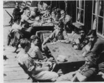
Otto Mayr-Hütte in d. Tannheimern

Bereits in den Anfängen entwickelte sich ein attraktives Vereinsleben. Die ersten Gemeinschaftsfahrten der Sekti-