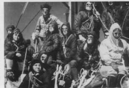
1963 auf der Wildspitze