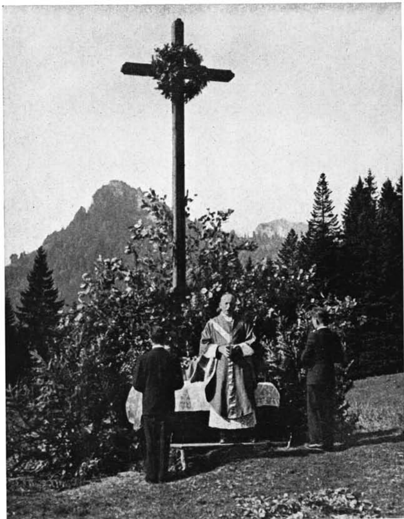
Weihe des Gedächtniskreuzes bei der Kasalm am 8. Oktober 1950