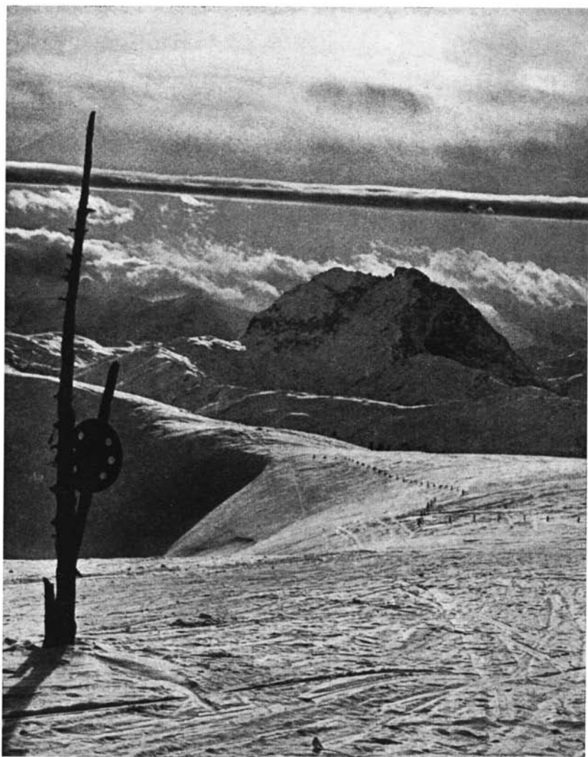
Blick zum „Großen Rettenstein“ Kitzbüheler-Alpen