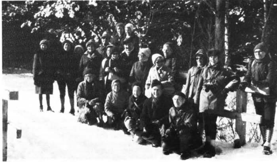
Sektions-Wandergruppe unterwegs in Februar 1978.