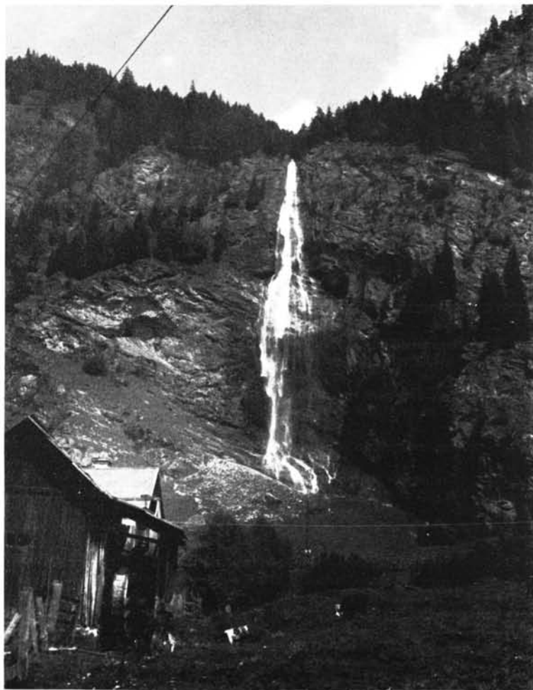
Wasserfall im Maltatal

"Man wird sich an den Vorzügen seiner Zeit nicht wahrhaft und redlich freuen, wenn man die Vorzüge der Vergangenheit nicht zu würdigen versteht". (Goethe)