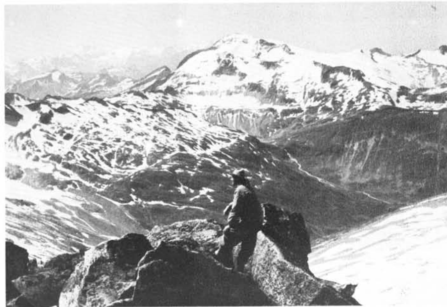
Blick von der Preimi-Spitz auf den Ankogel. Im Vordergrund das Großelend-Tal mit Fallbach, im Hintergrund der Großglockner.