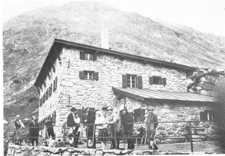
Sektionsmitglieder vor der neuen Osnabrücker Hütte, eingeweiht am 16. August 1931.