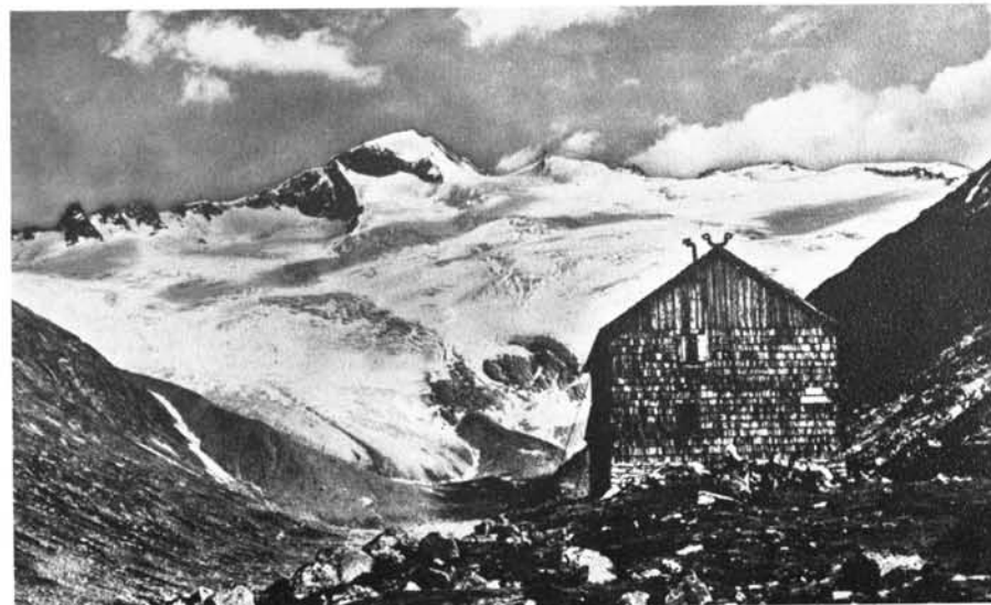
Die 1. Osnabrücker Hütte, eingeweiht am 24. 7. 1899, von einer Lawine 1929 zerstört.