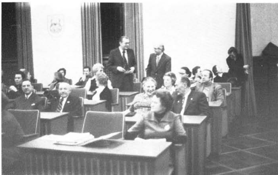
Blick in den Ratsitzungsaal während der Jubiläums-Hauptversammlung 1978.