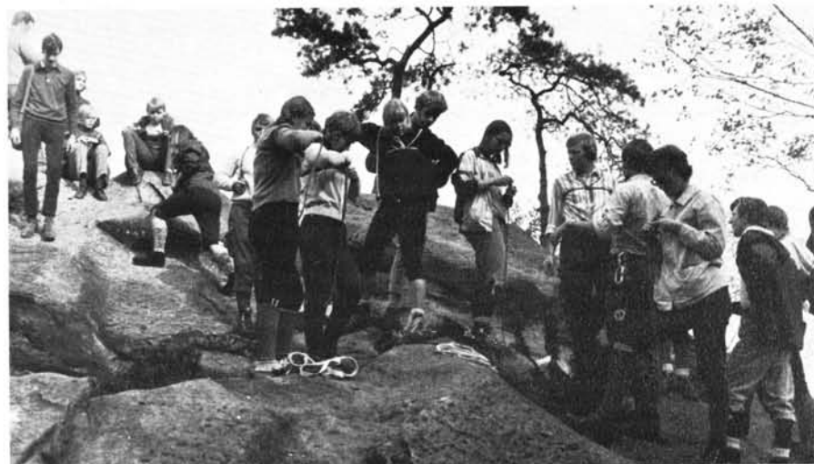
Sektionsjugend beim Kletterkurs in Brochterbeck.