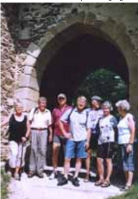
Ruine Schauburg, 21.06.07