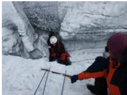
Spaltenbergung "Gleich ist es geschafft!"