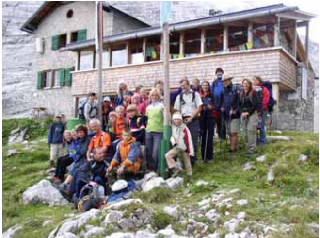
Schmidt Zabierow Hütte September 2007