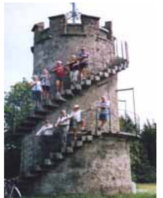
Aussichtsturm Mayrhoferberg 21.06.07