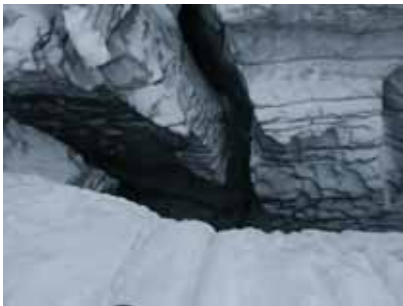
Spaltenzone am Hallstätter Gletscher