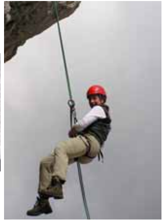
Grundkurs Klettern - Abseilen