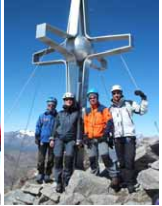
Hochtour in den Stubaier Alpen 27.-30.8.2007