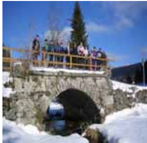
Ski-LLI-Tour Böhmis Röhren 04.02.07