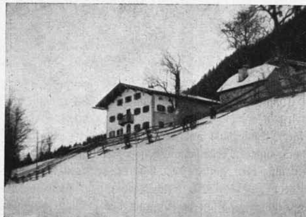
Die Skihütte in Weingarten.

mit 10 Nachlagern für den Winter 1935/36 pachten konnten; die kurze Schneedauer beeinträchtigte allerdings die Frequenz derselben. Für den Winter 1936/37 ist ein neuer Pachtvertrag abgeschlossen worden.