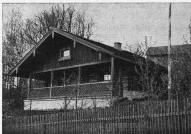
Die Hütte auf dem Reichenberg.

führten. Der Bau konnte bereits am 17. September begonnen werden auf einem der Sektion mit 99jährigem Pachtvertrag von dem Grafen von Geldern-Egmont auf Thurnstein in hochherziger Weise zur Verfügung gestellten Grundstück am Reichenberg.