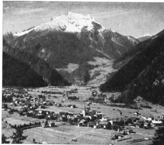
Mayrhofen /Tirol mit Grünberg