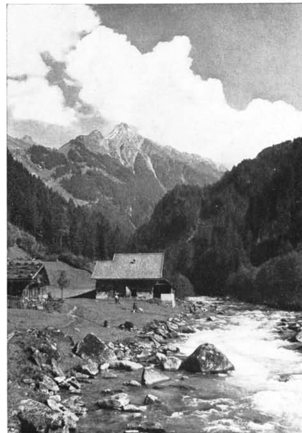
Zillergrund · Blick auf Brandberger Kolm