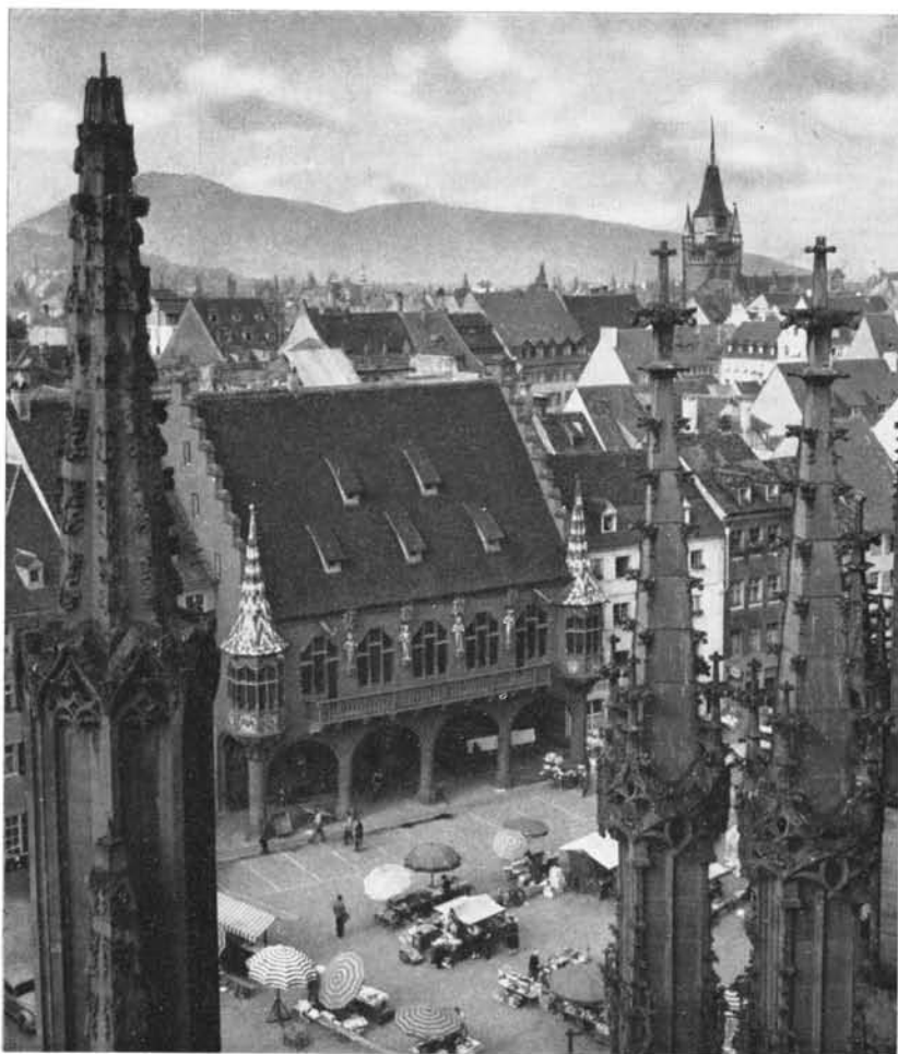
Freiburg im Breisgau · Münsterplatz mit Kaufhaus

dann, daß inmitten von Freiburg, am Colombischlößchen, ein Rebenhügel hart an der Kreuzung verkehrsreicher Stadtstraßen, selbstgefällig im Spiel der Sonne mit kräftigem Grün oder herbstlichem Braun und Rot prunkt. Der Besucher erkennt verwundert, daß die dunklen Berge bis in die alte Stadt mit hochstämmigem Wald herabsteigen; er erblickt den Schloßberg, auf dem einst drei Burgen standen, und die Talöffnungen, in die hinein die wachsende Stadt mit langen Straßenarmen greift, und umfaßt mit dem Blick endlich all die Berge des Schwarzwaldes, die sich in kühnem Schwung unter dem südlich-blauen Himmel hoch aufgewölbt haben.