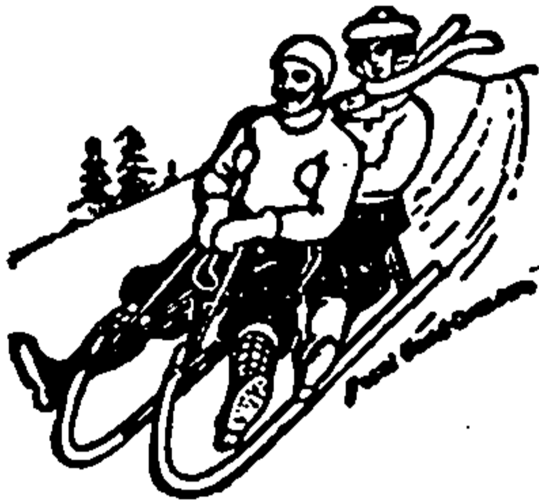
Sport- und Rodelschlitten (auch lenkbar) ohne Bremse.