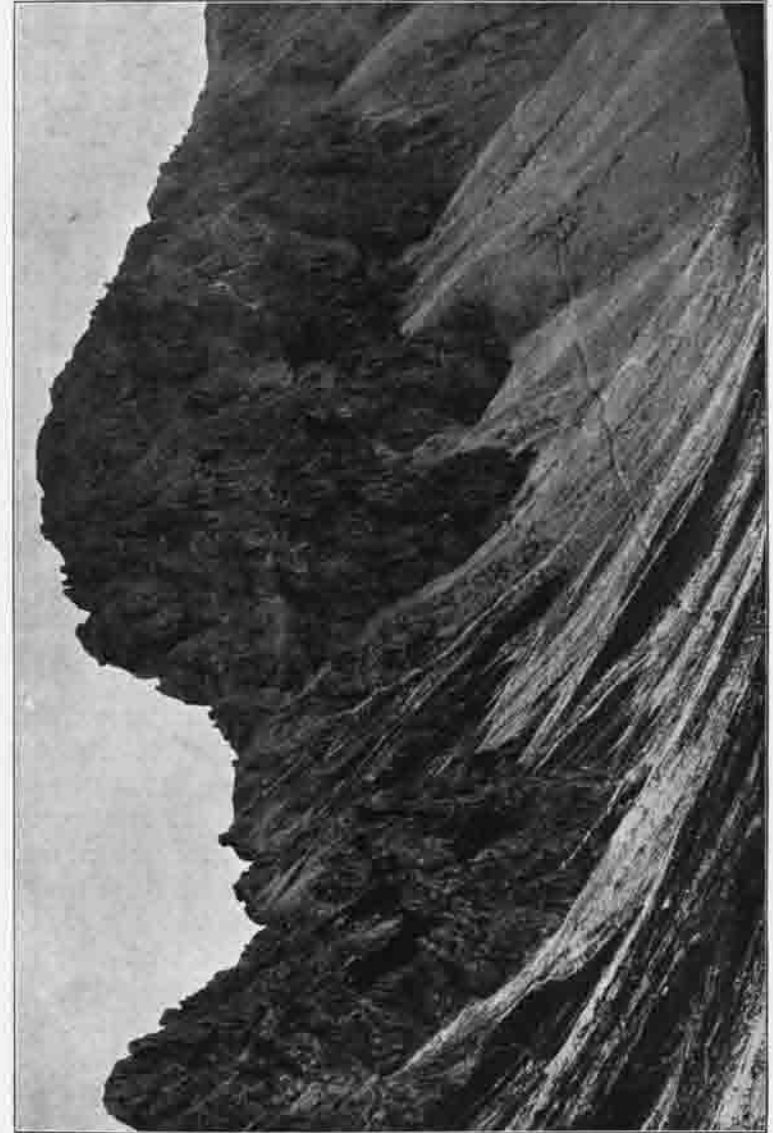
HOHER BURGSTALL, KALKKÖGEL, STUBAI.

Wie als bekannt vorausgesetzt werden darf, trägt sich unsere Sektion seit lange mit dem Gedanken, auch ihrerseits zur Förderung der Zwecke des Deutschen und Oesterreichischen Alpen-Vereins durch Errichtung einer Schutzhütte beizutragen. Nachdem dieser Gedanke die Genehmigung einer Hauptversammlung gefunden, wurde ein Hüttenbau-Ausschuß gewählt und damit beauftragt, die nötigen Vorarbeiten einzuleiten. Auf Vorschlag des Hüttenbau-Ausschusses hat eine spätere Hauptversammlung einstimmig beschlossen,