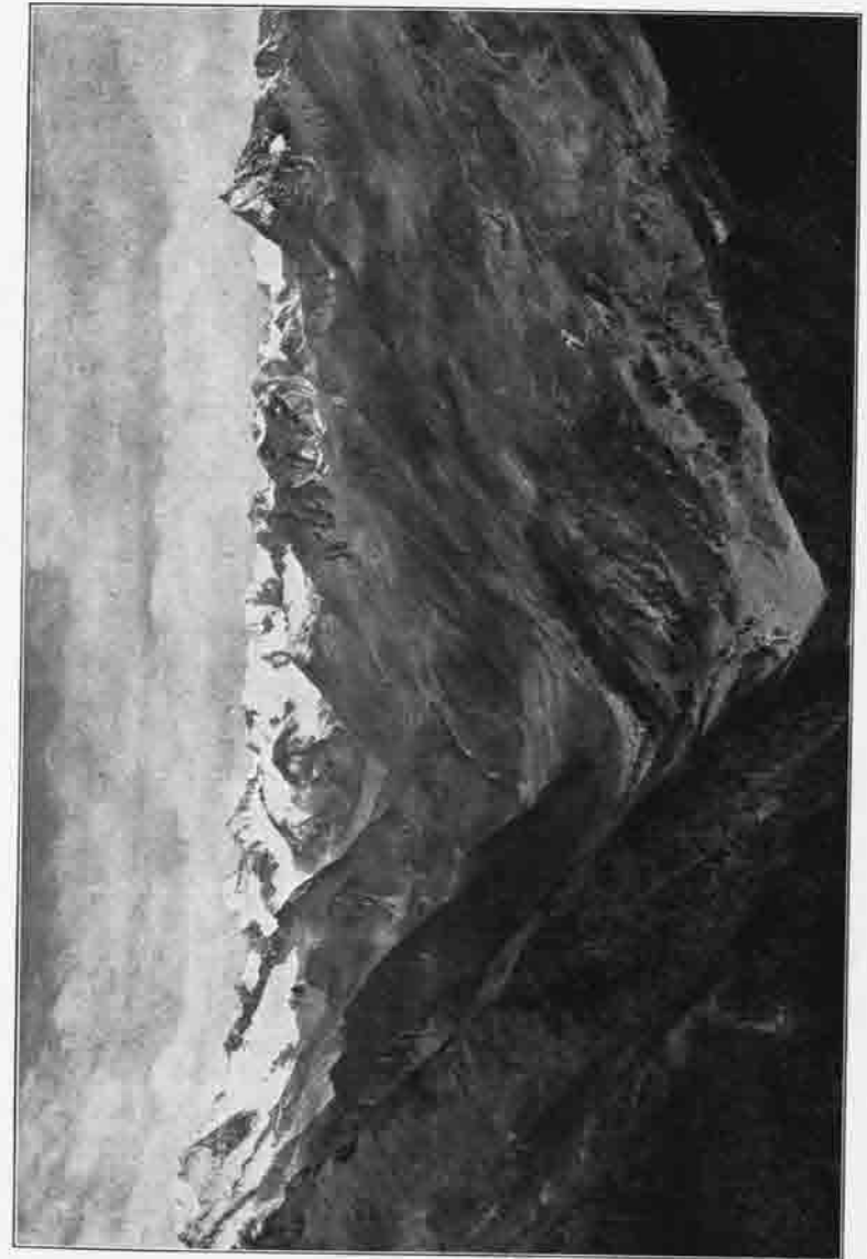
Blick in das Alpenertal von der Starkenburger Hütte aus.

Haben wir uns im Vorstehenden bemüht, über die Entstehung unserer lieben Sektion einen objektiven Bericht zu erstatten, so wollen wir nun im Anschluß daran versuchen, in gedrängter Darstellung von ihrer Entwicklung und ihrer Tätigkeit in den verfloßenen fünfundzwanzig Jahren ein möglichst anschauliches Bild zu entwerfen.