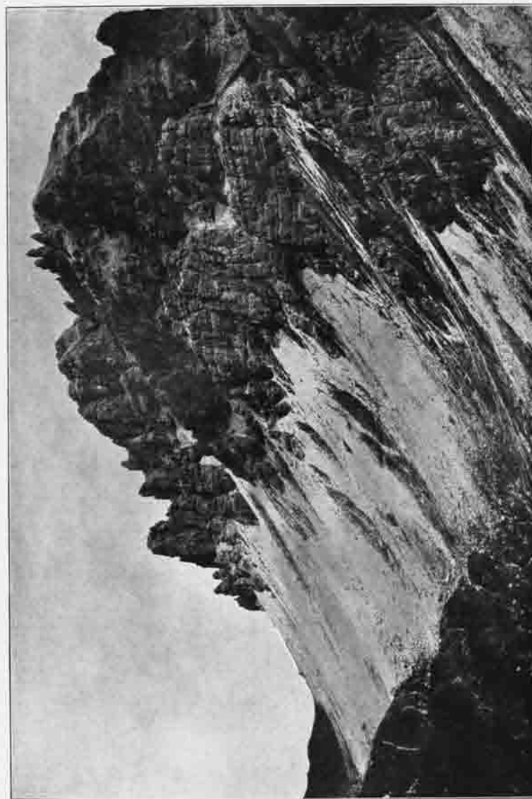
SEEJÖCHL UND SCHLICKERSESPITZE, KALKKÖGEL, STUBAI.