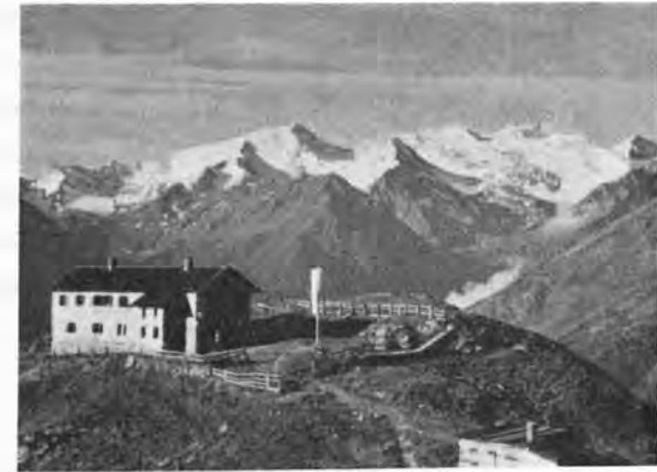
Starkenburger Hütte/Stubai/Tirol

stift sowie dem ganzen Stubai zum Heile diene. Die Arbeiten schritten rasch voran, so daß bereits Ende Juli der Hütten-Rohbau vollendet war. Bei einer Beteiligung von fast einhundert Personen wurde am 6. September 1900 die Hütte feierlich eingeweiht und ihrer Bestimmung übergeben. Der Vorsitzende, Stadtverordneter Egenolf, betonte in seiner Weihe-Ansprache „daß vor neun Jahren zwei Sektionsmitglieder auf ihrer Hochgebirgstour zu diesem herrlichen Fleckchen Erde gekom-