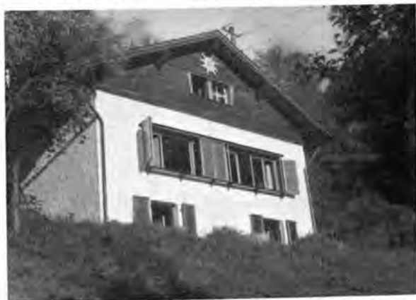
Die Felsberghütte in neuem Gewand.

Pfingsten (4.—6. Juni) trifft sich die Jugendgruppe auf der Felsberghütte. Wanderung „Rund um den Felsberg“.