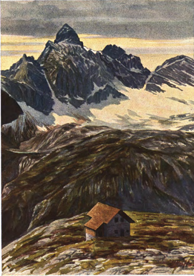
„Württembergischer Haus“ mit Spießrutenspitze.