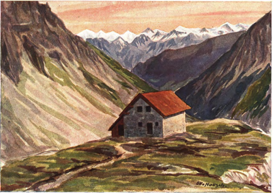
„Württembergischer Haus“ gegen die Öztaler Alpen.